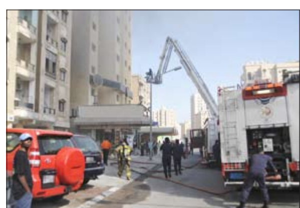
بعض السكان تم إخلاؤهم بالسلام