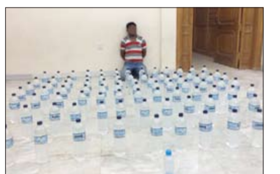
مضبوبات أمن الفروانية من الخمور