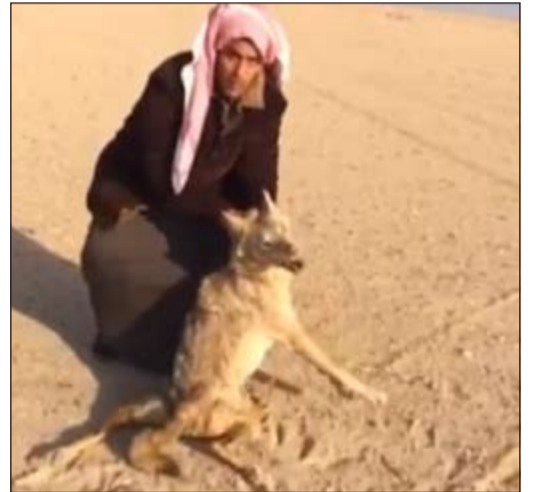
المواطن الشاب وقد أمسك بالذئب