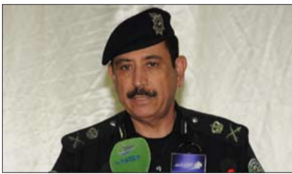
اللواء عبدالله المهنا متحدثا في «الورشة الإستراتيجية للمرور»