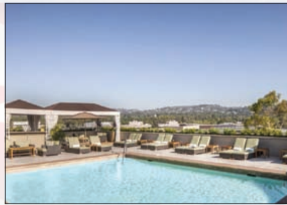
يقع هذا الفندق - من فئة الـ 5 نجوم - على مسافة سير قريبة من شارع روديو درايف الشهير. ويضم الفندق مسجدا على السطح وخدمات رائعة.

لبيفرلي هيلز وهوليوود قصة قديمة تعود الى نحو 100 عام من الآن، كما ان تسمية هوليوود ليست جديدة فهي تعني «الغاية المقدسة» وسميت بذلك قبل نحو 200 سنة نسبة الى صليب وضع على احدى تلالها وهو لا يزال موجودا