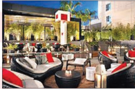
يقع في قلب هوليوود وبالقرب من ممشى المشاهير يقدم مسبح على السطح وسبا كامل الخدمات. ويقدم الفندق أيضا خدمة Whatever/Whenever على مدار 24 ساعة لحجوزات العشاء وترتيبات النقل وأكثر من ذلك. كما يضم مطعم Delphine المأكولات الأميركية العصرية المستوحاة من كاليفورنيا.