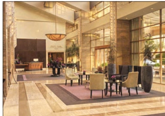
يقع هذا الفندق على مسافة قصيرة سيرا على الاقدام من استوديوهات «فوكس القرن العشرين» ومسافة اقل من 2,4 كم من روديو درايف. وتضم جميع الغرف الواسعة تراسا خاصا مع اطلالات على المدينة.