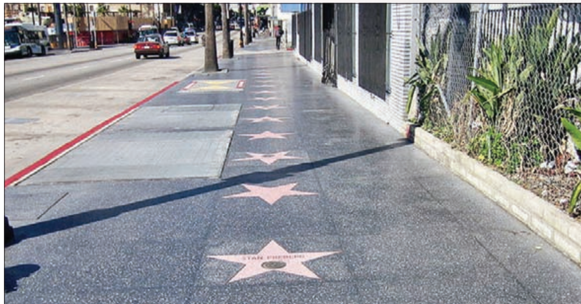
مشى النجوم في هوليوود