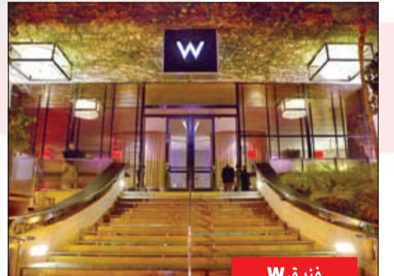
فندق W لوس انجليس - ويستود على مسافة دقائق من متحف هامر وفاولر وبالقرب من جامعة كاليفورنيا في لوس انجليس. فندق تتوافر فيه كل وسائل الترفيه وحمام سباحة مكشوف ومميز.