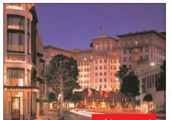
إلى جانب موقعه المميز يضم هذا الفندق الرائع مسجدا على طراز البحر الأبيض المتوسط وحوض استحمام ساخن مزود بشاليهات خاصة تتوافر خيارات مميزة لتناول الطعام فيه ويضم مطعمي Cut الذي يوفر قائمة شرائح اللحم والأطعمة البحرية ومطعم BLVD.