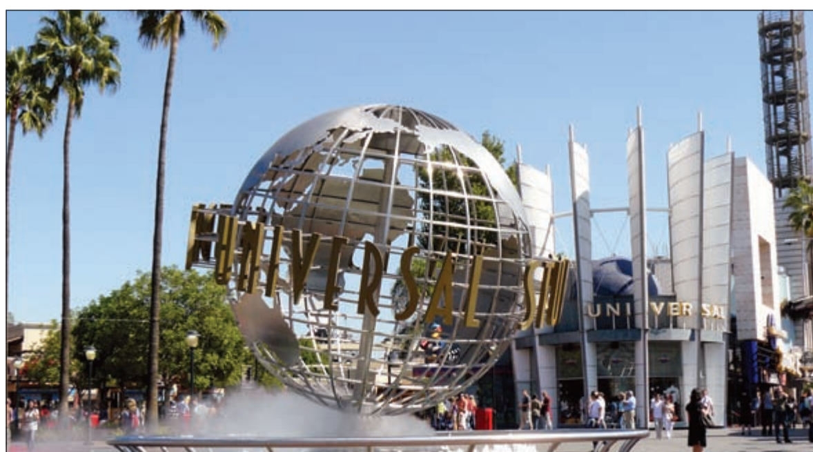
استوديوهات يونيفرسال في لوس انجليس