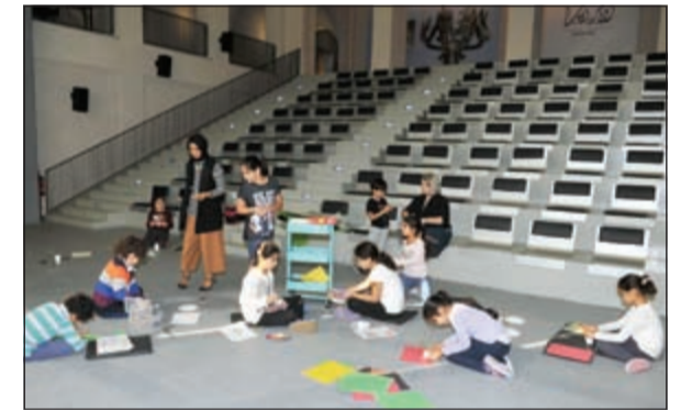
جاناب من ورش العمل للأطفال