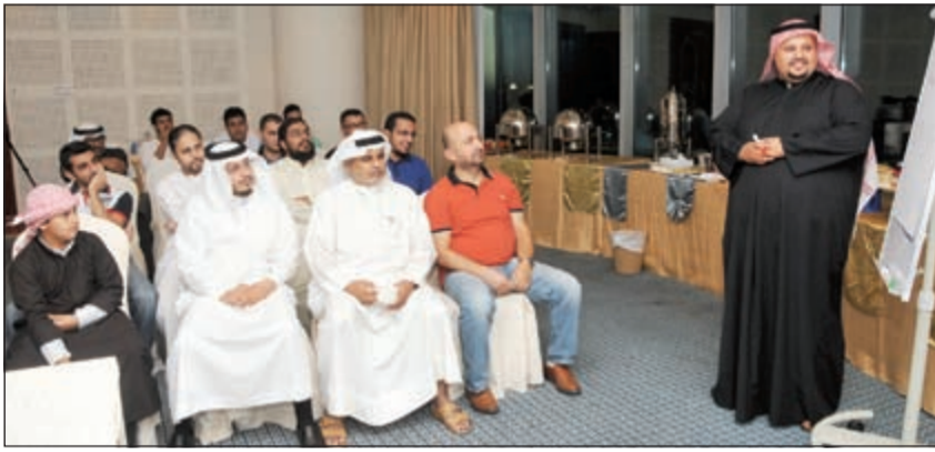
جاناب من الحضور يتابعون توضيحا حول برنامج «ديسكفري»