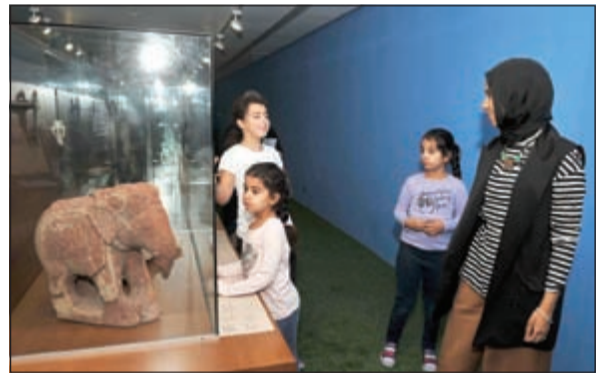
أنشطة تثقيفية للأطفال