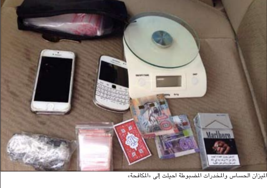
الميزان الحساس والمخدرات المضبوطة احيلت إلى «المكافحة»