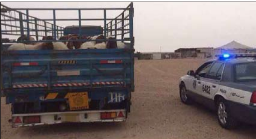
الاغنام المسروقة في سيارة المتهمين