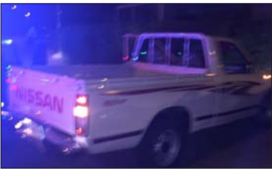
وانت الشرطي الخليجي