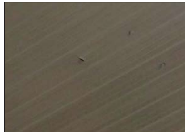
آثار الطلق الناري تبدو على سقف المقهى

كتبت النجاة لمجموعة من الشباب الذين كانوا يجلسون في مقاعد مقهى بصناعية الجهراء بعد ان اخترقت طلقة طائشة الكيربي الذي كانوا يجلسون تحته، وقال المصدر ان مجموعة من الشباب كانوا يجلسون في مقهى بصناعية الجهراء مساء امس الاول وفوجئوا بصوت اختراق الكيربي وسقوط طلقة على الارض دون ان يعرف مصدرها.