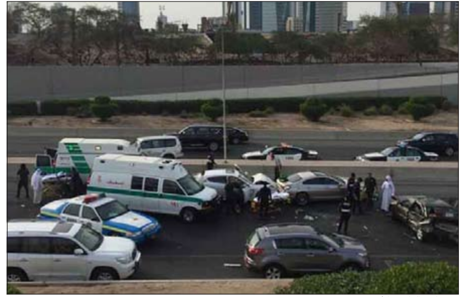
من حادث الدائري الأول