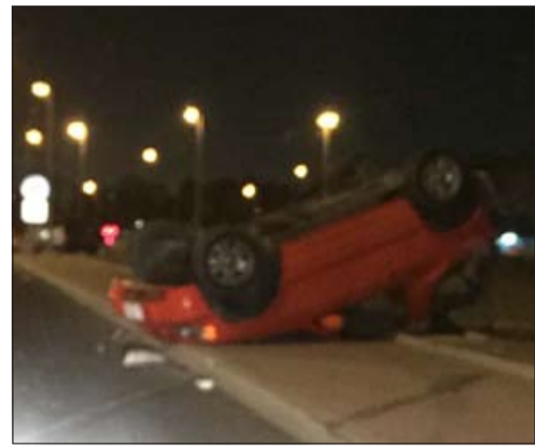
المركبة وقد انقلبت بشكل تام

حركة السير بشكل لافت على الدائري الأول نظرا لانحراف المركبتين على الاتجاهات الثلاثة.