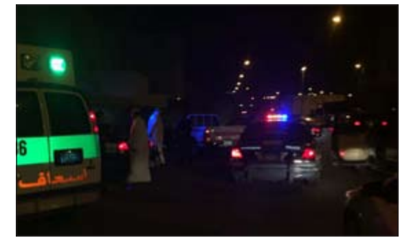
سيارة إسعاف خلال نقل رجل امن الجهراء المصاب