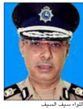
لواء سيف السيف

أكد مدير عام الإدارة العامة للأمنية في وزارة الداخلية وأمين سر نادي ضباط الشرطة اللواء سيف السيف أن المخيم الربيعي لنادي ضباط الشرطة لعام 2014 - 2015 يأتي تأكيدا للتواصل مع أعضائه بكل ما هو مفيد ومتميز في جميع أوجه النشاطات المتاحة والملائمة لجميع أفراد أسر الضباط من منتسبي النادي من أبناء وزارة الداخلية وعائلاتهم، لافتا إلى أن نادي ضباط الشرطة يعد صرحا اجتماعيا بارزا يجسد رعاية واهتمام القيادة السياسية بأبنائنا من ضباط الشرطة وأسرتهم. وأشار إلى ان افتتاح المخيم