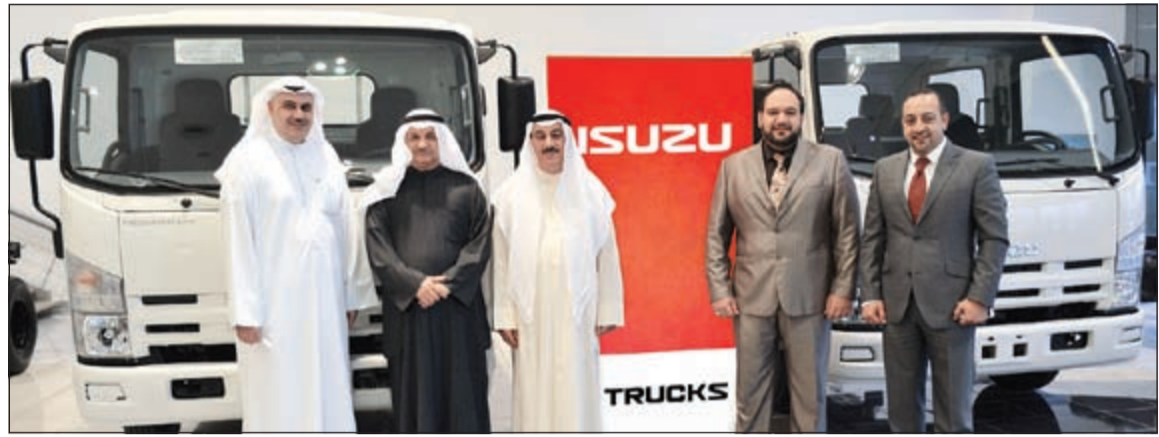
خلال تسليم أسطول السيارات في معرض إيسوزو

شراكتها العريقة مع شركتي سيارات إيسوزو بتوريد وتعزيز السوق الكويتي بأفضل موديلات السيارات والمركبات التي تتلاءم مع أجواء المنطقة المناخية الشاقة وتتوافق بأسعار تنافسية تجعلها الاختيار الأول لأساطيل سيارات الشركات الكبرى المتخصصة التي تتطلب في مركباتها مواصفات استثنائية لتأدية مهامها على الوجه الأمثل.