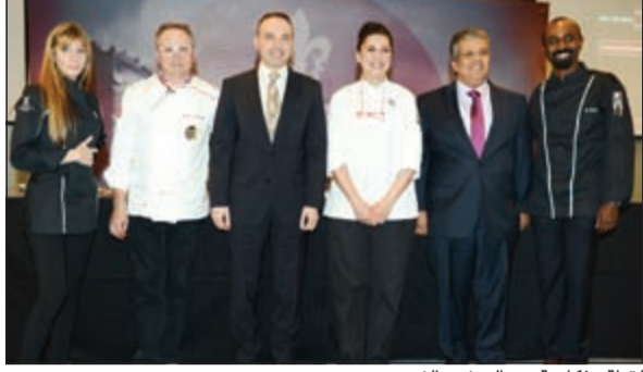
لقطة تذكارية مع السفير الفرنسي

وتأسست شركة FAME عام 2000 في فرنسا وانتقلت لاحقاً إلى الكويت سنة 2001 حيث كانت بداياتها كممثل تجاري يروج للمنتجات الفرنسية الأصل في مجال صناعة الأغذية.