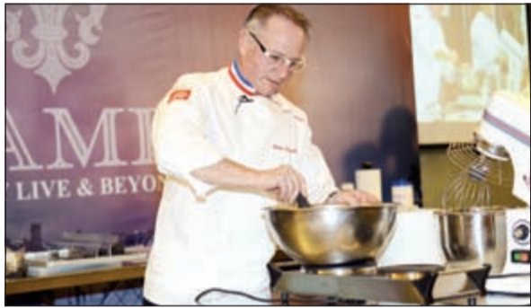
الشفيف برونو، وتقديم رائع