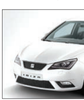
سيات... إسبانية بتقنية ألمانية

شراكتها العريقة مع شركتي سيارات إيسوزو بتوريد وتعزيز السوق الكويتي بأفضل موديلات السيارات والمركبات التي تتلاءم مع أجواء المنطقة المناخية الشاقة وتتوافق بأسعار تنافسية تجعلها الاختيار الأول لأساطيل سيارات الشركات الكبرى المتخصصة التي تتطلب في مركباتها مواصفات استثنائية لتأدية مهامها على الوجه الأمثل.