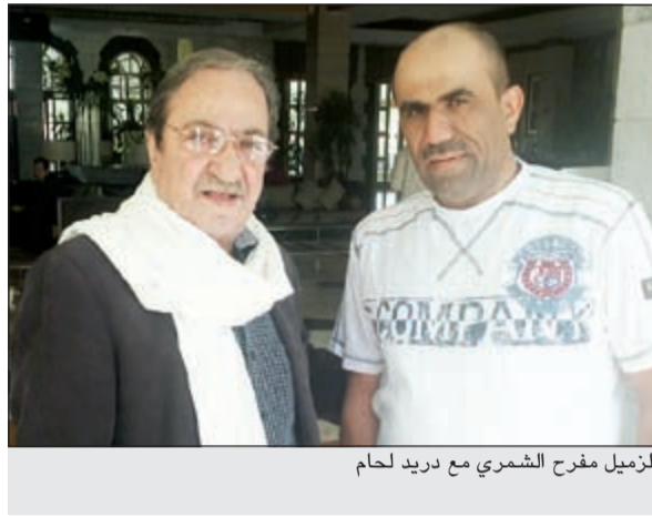
الزميل فرح الشمري مع دريد لحام