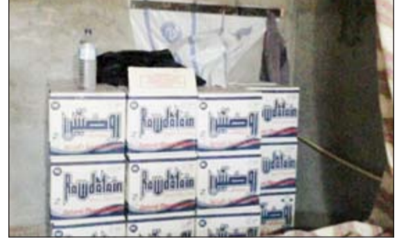
الخمور المضبوطة التي كانت بالمهبولة

المدمرة، وأهابت إدارة الإعلام الأمني بالمواطنين والمقيمين الإبلاغ عن أي مخالفات أو معلومات بهذا الصدد عن طريق هاتف الطوارئ 112 الذي يتلقى البلاغات والاتصالات على مدار الساعة.