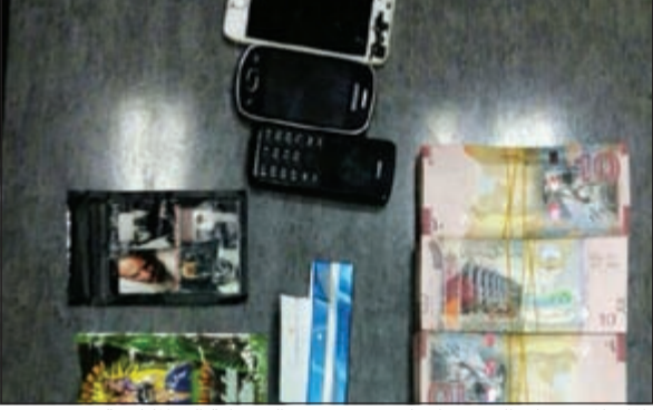
المال المضبوط والحبوب احيات في محضر الضبطية الى المكافحة