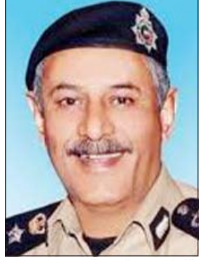
اللواء زهير النصرالله

جانب 5 حبات كابتي و7 حبات كيميكا الى جانب 7 أظرف يشبته في احتوائها على ميروين، وقال مصدر أمني ان ضبط المواطن من قبل دورية تحتجاء إثر الاشتباه في قيادته للسيارة المخدرة وإرفاق مبلغ 5190 في محضر الاحالة يرجح ان تكون حصيلة بيع مواد مخدرة الى