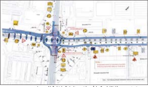
رسم توضيحي للتقاطع كما أرسلته وزارة الداخلية للصحف

أعلنت الإدارة العامة للمرور انه وبالتعاون مع وزارة الأشغال العامة سيتم افتتاح تحويلة مرورية (دوار محكوم بإشارة ضوئية) على طريق جمال عبدالناصر وتقاطع مع طريق الغزالي تحت الجسر، وذلك فجر اليوم الجمعة. وأهابت الإدارة العامة للمرور بقائدي المركبات ومستخدمي طريق جمال عبدالناصر وطريق الغزالي الى توخي الحيلة والحذر.