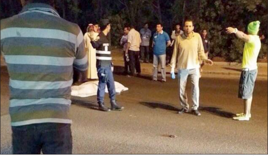
جثة الأم بانتظار سيارة الطب الشرعي فيما الطفلة نقلت للعلاج

الداخلية في ساعة متأخرة من يوم امس الأول عن حادث دهس على الطريق الساحلي مقابل منطقة أبو حليفة، وبانتقال رجال الأمن تبين أن الأم كانت تحمل ابنتها الرضيعة تعبر الطريق الساحلي إذ بمركبة بقيادة شاب كويتي من مواليد 1990 تعبر الطريق مسرعة فتصطدم وتدهسها، وتسبب الحادث في عرقلة شديدة على الطريق الساحلي نظراً لوقوع الحادث في الحارة الوسطى، وتم التحفظ على الداهس في مخفر أبو حليفة وتسجيل قضية دهس ووفاة برقم 1752 / 2014.