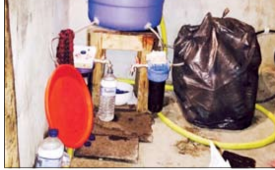
ادوات التخبير كانت تسهم في صناعة الخمور