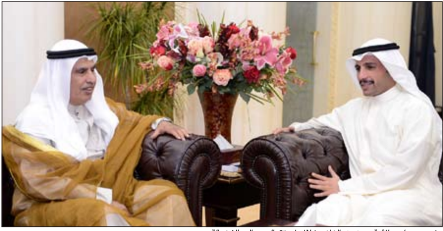
رئيس مجلس الأمة مرزوق الغانم خلال استقباله صالح الفضالة

من جانب آخر بعث رئيس مجلس الأمة مرزوق علي الغانم برقيتي تهنئة الى كل من رئيس مجلس الشورى في سلطنة عمان الشقيقة خالد بن هلال بن ناصر المعولي، ورئيس مجلس الدولة د.جبي بن محفوظ المنذري، ورئيسة البرلمان سايميا في جمهورية لاتفيا سولفيتا ابولتينا، وذلك بمناسبة الأعياد الوطنية لبلادهم.