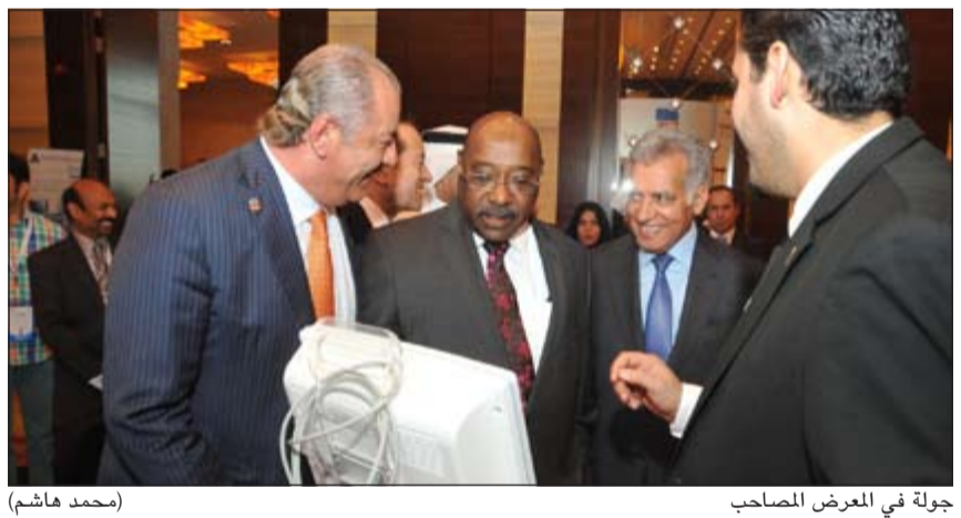
جولة في المعرض المصاحب (محمد هاشم)