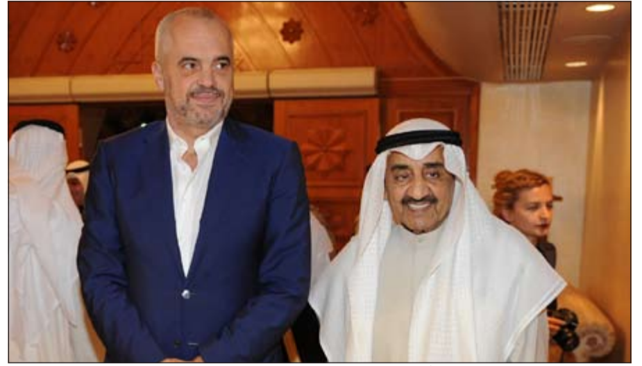
جاسم الخرافي مستقبلا رئيس وزراء البانيا ابيدي لاما