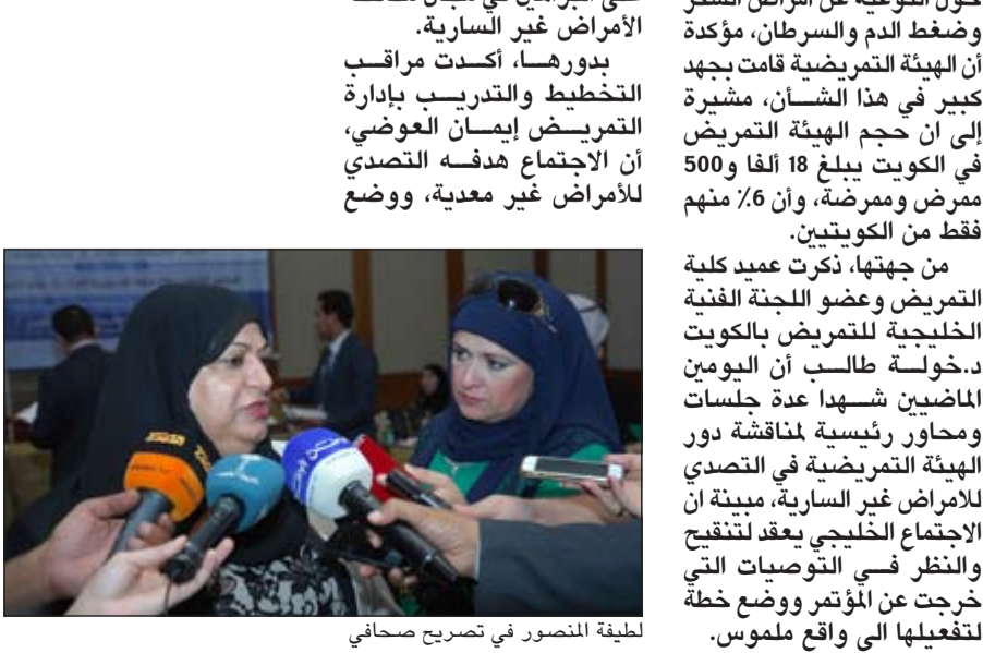
لطيفة المنصور في تصريح صحفي

استراتيجيات موحدة مع دول مجلس التعاون للنصدي ومكافحة الأمراض غير المعدية، مبيحة أنه سيتم تحديد التوصيات بخصوص هذا الموضوع. ولفتت الى ان هناك توصيات كثيرة خرجت، من أهمها وضع استراتيجيات لمكافحة مضاعفات هذه الأمراض والحد منها لأنها تعتبر عبئا اقتصاديا واجتماعيا على الدول، مبيحة أن المؤتمر استعرض في جلساته عددا من البحوث والدراسات المبينة على البراهين لتحديد نسب الإصابات في دول مجلس التعاون بشكل عام، مبيحة ان نسبة الإصابة بالأمراض غير المعدية في الكويت تقارب 30% بشكل عام، والتي تتصدها أمراض القلب، خاصة بين الأعمار التي هي دون الستين عاما.