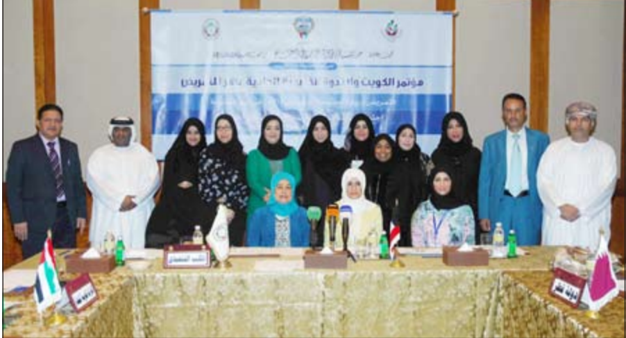
عدد من المشاركين في اجتماع اللجنة الخليجية الفنية للتمريض (هاني عبدالله)

استراتيجيات موحدة مع دول مجلس التعاون للنصدي ومكافحة الأمراض غير المعدية، مبيحة أنه سيتم تحديد التوصيات بخصوص هذا الموضوع. ولفتت الى ان هناك توصيات كثيرة خرجت، من أهمها وضع استراتيجيات لمكافحة مضاعفات هذه الأمراض والحد منها لأنها تعتبر عبئا اقتصاديا واجتماعيا على الدول، مبيحة أن المؤتمر استعرض في جلساته عددا من البحوث والدراسات المبينة على البراهين لتحديد نسب الإصابات في دول مجلس التعاون بشكل عام، مبيحة ان نسبة الإصابة بالأمراض غير المعدية في الكويت تقارب 30% بشكل عام، والتي تتصدها أمراض القلب، خاصة بين الأعمار التي هي دون الستين عاما.