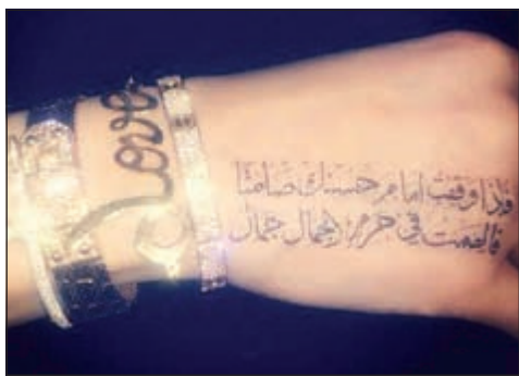
وشم هيفاء الجديد

يذكر ان هيفاء كانت قد أطلقت أغنيها الجديدة «أويا» من مسرح «ستار اكاديمي»، حيث حلت ضيفة في البرامج العاشر، ولقت الانتظار إليها واستطاعت أن تثير الجدل بين الجمهور وأهل الصحافة وعبر مواقع التواصل الاجتماعي بعد ارتدائها فستانا أسود شفاف.