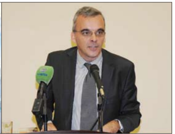
ممثل السفير الفرنسي فرانسوا بروسار متحدثا