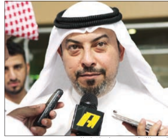
الشيخ طلال الفهد يتحدث لوسائل الإعلام

الحظر الدولي عن الملاعب العراقية.. وأضاف «بعدها سيتم التأكد من اكتمال المنشآت ومن الحالة الأمنية في العراق»، مشيرا إلى أن موعد إقامة «خليجي 23» سيكون في يناير 2016. وفي حال عدم رفع الحظر عن العراق أو عدم توافر الاستقرار الأمني، فإن الكويت تستضيف الدورة المقبلة، حسب التسلسل في احتضان الدورة بين الدول المشاركة فيها. واعتمد رؤساء الاتحادات