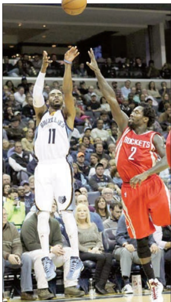
لي نجم ممفيس يتلقى أمام روكيتس

وكان الاتحاد الروسي يريد أن يتواجد كابيلو حتى مونديال روسيا 2018 ولكن يبدو أن إقالته من منصبه أصبحت قريبة في هذه الفترة عن أي وقت مضى. وذكرت تقارير صحافية أن المدرب كابيلو أصبح قريبا من الرحيل عن صفوف الفريق لأنه غير راض عن الظروف المحيطة به، وقد عزم على تقديم الاستقالة بعد عدم قدرة الاتحاد الروسي على دفع راتبه المذكور في العقد.