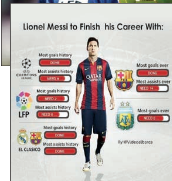
إحصائية مثالية للنجم الأرجنتيني

رصيده 22 هدفا سجلها في رمي النادي الملكي، والتي جانب أرقام اللاعب داخل قلعة النادي الكاتالوني فإن «ليو» يعد الهدف التاريخي للبلوغرانا برصيد 364 هدفا حتى الآن بينما يتبقى له صناعة 14 هدفا أخرى مع البارسا حتى يحتل صدارة صانعي الأهداف لدى البلوغرانا.