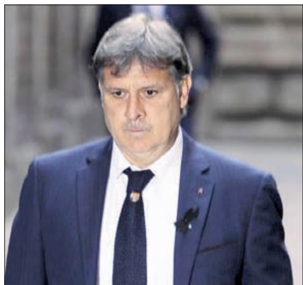
تاتا يعلن مرشحه للكرة الذهبية

قد يختلف كثيرون حول هوية أفضل لاعب كرة قدم في العالم ومن يستحق الفوز بالكرة الذهبية، لكن جيراردو مارتينو مدرب الأرجنتين يرى أنه يوجد شخص واحد يستحق الجائزة.