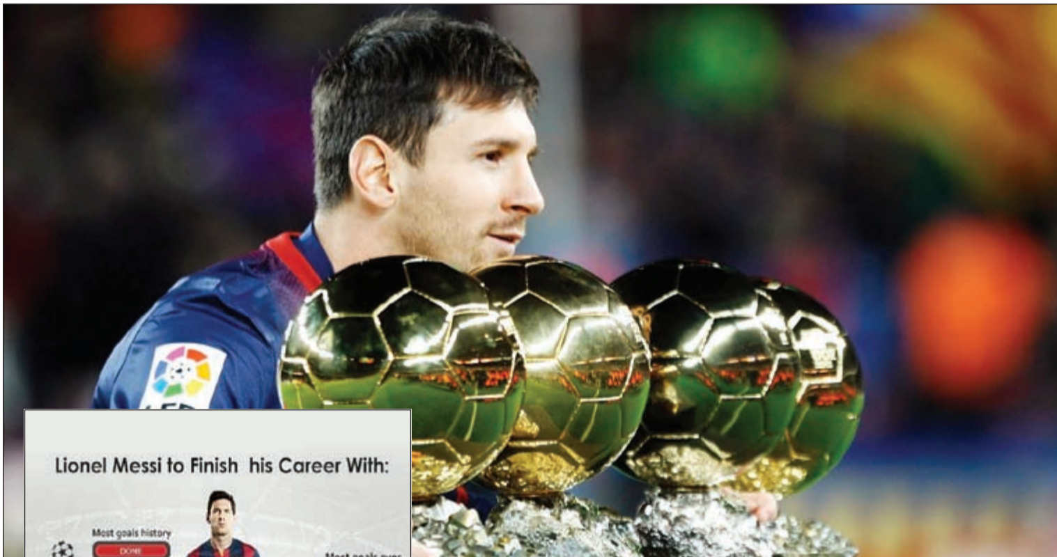
الصورة وحدها تتحدث عن إنجازات ميسي