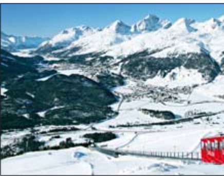
سحر الطبيعة في سويسرا

الخليجية من أهم المناطق التي تستقطبها هيئة السياحة السويسرية ببرامجها الترويجية، حيث بلغ عدد السياح الخليجيين القادمين إلى سويسرا خلال الفترة من يناير إلى سبتمبر 2014 حوالي 221 ألف سائح بزيادة 22% عن نفس الفترة من 2013 فيما تصدرت السعودية السياحة الخليجية لتلحق الإمارات فالكويت وقطر وعمان وأخيرا البحرين. وتطلق سويسرا مجموعة مميزة من العروض والبرامج الترفيهية الرائعة بمناسبة احتفالاتها بمرور 150 عاما على انطلاق سياحتها الشتوية والتي وضعت سويسرا في مقدمة الدول التي تستقطب الملايين سنويا من حول العالم لقضاء أشهر الشتاء الجميلة بين جبالها ومنتجعاتها الفاخرة. وتستقطب هيئة السياحة السويسرية باعتبارها الجهة المعنية بتشجيع السياحة والترويج للعروض المميزة