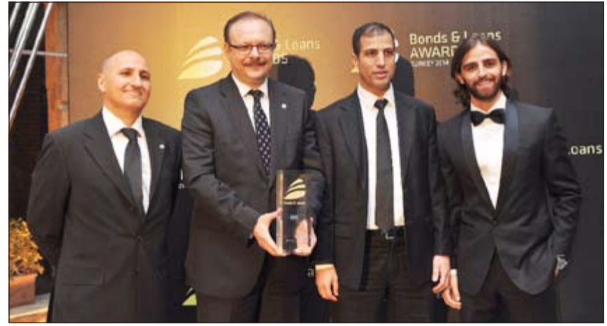
مسؤولون من «بيتك - تركيا» يتسلمون الجائزة

تركيا، وأصدر أول إصدار له من الصكوك في 2010 لمدة سنتين بمبلغ 100 مليون دولار أميركي، تلاه الإصدار الثاني وهي صكوك لأجل خمس سنوات بمبلغ 350 مليون دولار في 2011. وفي يونيو الماضي أصدر «بيتك - تركيا»، صكوكا بقيمة 500 مليون دولار، مدتها 5 سنوات، شهد الإصدار إقبالا كبيرا، واجتذبت طلبات اكتتاب تزيد قيمتها على 3.25 مليارات دولار، بعد أن حاز اهتماما عالميا من مستثمرين