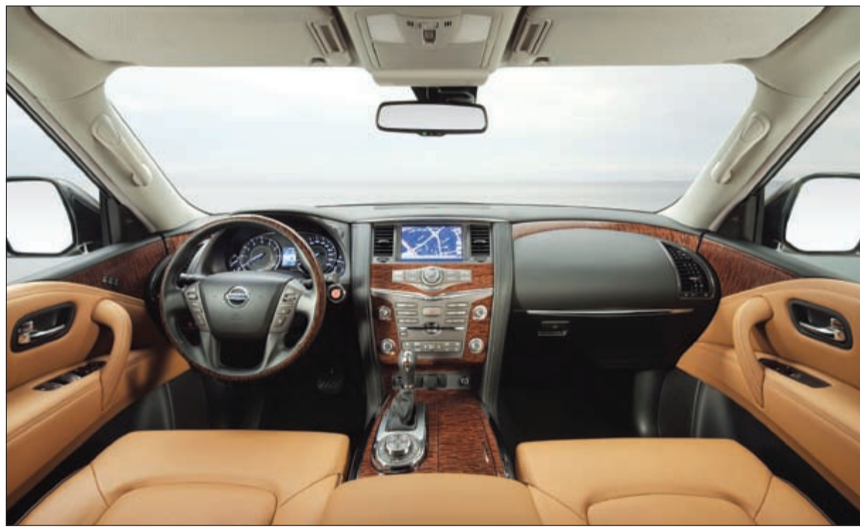
مقصورة بلمسات فاخرة