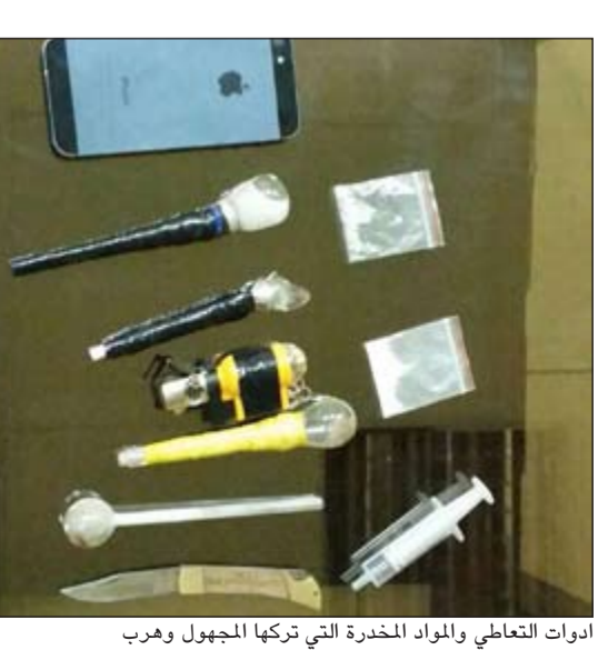
أدوات التعاطي والمواد المخدرة التي تركها المجهول وهرب

الجرائم المتعلقة بهذه السموم ومرتكبها ومروجيها، وختم حديثه، متمنياً من الطالبات التعاون والإبلاغ عن أي جريمة ترتكب في هذا الإطار. وانتقل بعد ذلك الحديث لضابط قسم التوعية الملازم أول شذى الرقدان والتي بينت للطالبات الفرض العلاجية المتاحة للمدمن والتي كفلها القانون وهما التقدم الطوعي لمركز الإدمان، أو التقدم ببلاغ شكوى الإدمان وهي فرصة منحت للأقارب من الدرجة الأولى والثانية، كما بينت عقوبة الجليس التي تصل للحبس لمدة عامين وحذرت الطالبات من مخالطة أقران