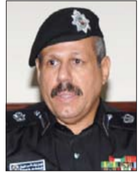
اللواء الشيخ فيصل النواف

قام وكيل وزارة الداخلية المساعد لشؤون التعليم والتدريب اللواء الشيخ فيصل النواف، بزيارة معهد الهيئة المساندة متفقدا سير العملية التعليمية والتدريبية للطلقات، للاطلاع ومتابعة أداء العمل لضباط وأفراد معهد الهيئة المساندة اليومي بالإضافة إلى معرفة الجدول الزمني اليومي للطلقات، وعلى هامش الزيارة عقد اجتماعاً بحضور الهيئة التعليمية وأكد من خلاله أن العنصر النسائي منذ التحاقه