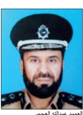
العقيد عبدالله العجمي

الباعة الجائلين، وأيضاً ضبط 14 شخصاً ضبطاً أمنياً و10 أشخاص ضبطاً جنائياً، إلى جانب حجز مركبة مخالفة ومضبط 6 مشاجرات و5 وقائع مخدرات و2 واقعة سرقة وتلقي 414 بلاغاً، بالإضافة إلى إحالة 16 شخصاً إلى الإبعاد الإداري وتقديم 225 مساعدة إنسانية وتنفيذ 40 نقطة تفتيش و62 تواجداً وثبوتاً أمنياً في مناطق حولي والسالمية وجنوب السرة.