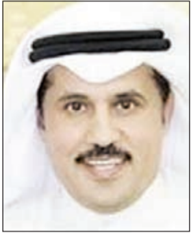
اللواء صالح الغنم

المخدرات تفيد بقيام وأحد من جنسية عربية يسكن في منطقة الصليبية بالاتجار بالمواد المخدرة وتعاطيها، وبعد إجراء التحريات اللازمة واستصدار إذن النيابة العامة تمت مدهمة مسكن الوافد وضبط وافد من جنسية عربية المضبوطات تخصه. وتمت إحالة المتهم والمضبوطات إلى جهات الاختصاص للتحقيق واتخاذ اللازم.