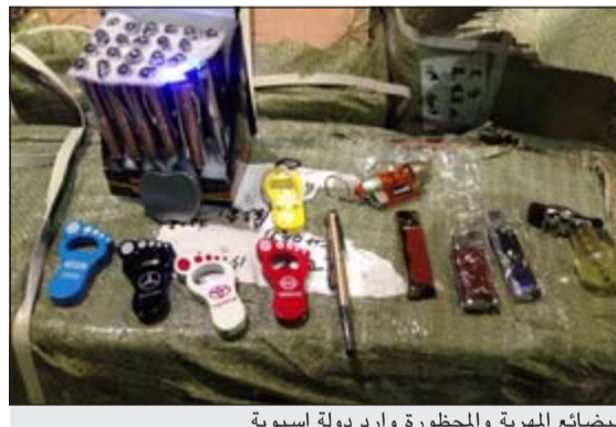
البضائع المهربة والمحظورة وارد دولة أسبوية

شكلاً ومضموناً. وقد ناقش مع الحضور بعض الأمور المتعلقة بعمل المعهد كونه أحد الروافد العميلة للأجهزة الأمنية، مشيراً بذلك إلى أن عرض كل الأمور على بساط البحث والدراسة من شأنه الارتقاء بالعمل، كما استمع إلى بعض الآراء والملاحظات، واعداً بتدليل كل الصعاب أمام الهيئة التعليمية حتى يتمكنوا من القيام بواجبهم على الوجه الأكمل. وأوضح للحضور أنه