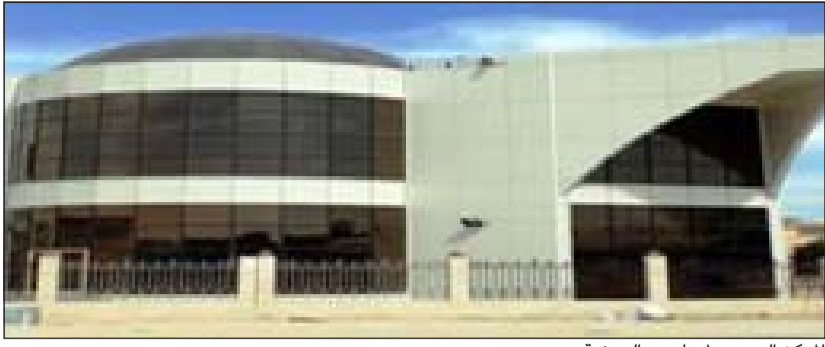
المركز الصحي لمساهمي الروضة