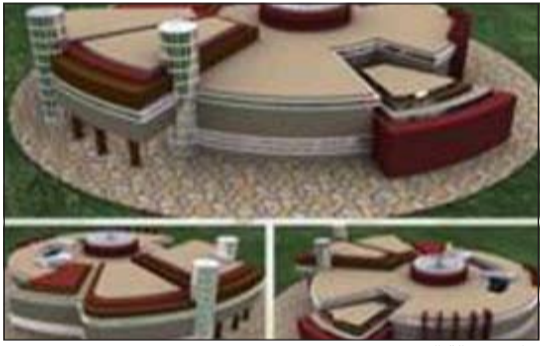
تطوير صالة الزين