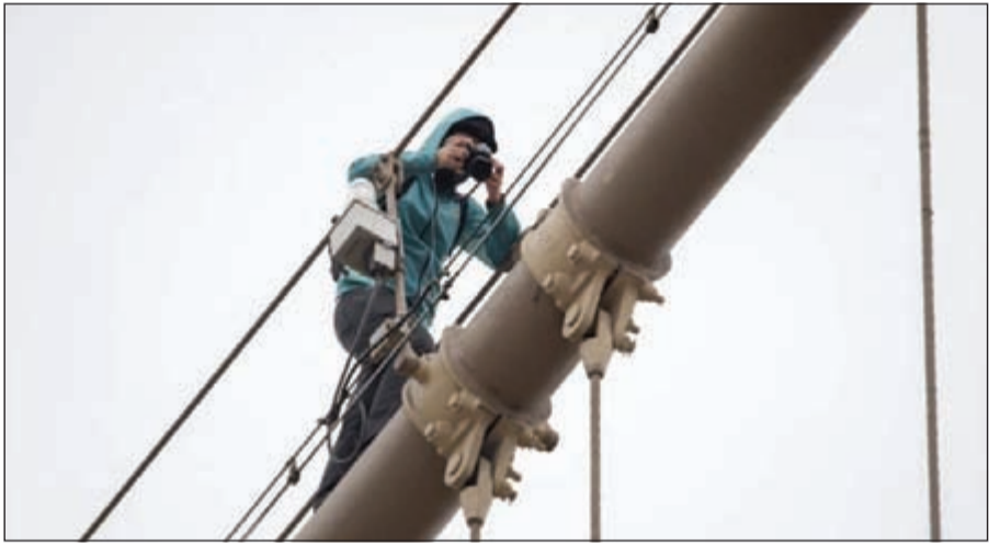
السائح الفرنسي يلتقط الصور فوق الجسر قبل القبض عليه

نيويورك - أ.ف.ب: أوقفت الشرطة الأميركية سائحا فرنسيا في سن 23 عاما في نيويورك بعدما تسلق جسر بروكلين لالتقاط الصور على ما يبدو، على ما أفادت الشرطة، ووضع الشاب قيد التوقيف الاحتياطي واتهم بالقيام بسلوك متجاهل وانتهاك حرمة الملكية، وأوضح متحدث باسم الشرطة ان الشاب اوقف بعدما قفز فوق سياج الخاصة الانائية وسيلاحق على سلوكه مانهاتن ببروكلين، ثم نزل السائح الفرنسي يطلب من شرطي كان يشارك في دورية في المكان ولاخط تسلقه للجسر فبادر الى توقيفه، ومن المتوقع توجيه اتهام رسمي خلال اربعة اشهر.