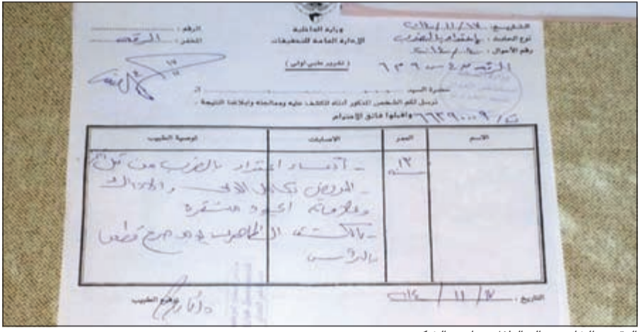
التقرير الخاص بوالد الطفل صاحب الشكوى

اشتكى مواطن يوم الاحد الماضي الاطباء في مستشفى العدان «قسم الحوادث»، وفي التفاصيل كما رواها مواطن ان ابنه تعرض لضرب باثة حادة في المدرسة، وعند الدخول لطبيب الجراحة فوجى الاب بعدم الكشف عليه نهائيا وقام بتحويله للعمليات الصغرى، وكشف المواطن انه استفسر من الطبيب قائلا: لماذا لم تكشف على الجرح خاصة ان الجرح قريب جدا من عين المصاب، وايضا عدم ذكر الضرب باثة حادة في التقرير الطبي حتى يقدمه للمخفر؟ واذا بالطبيب ينهره بصوت عال امام جموع المراجعين قائلا: انت بتعلمني