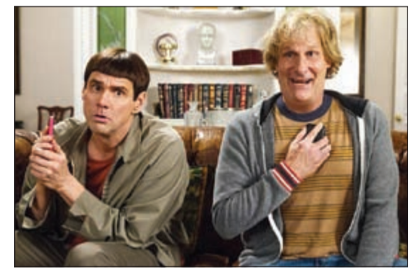
جيم كاري وجيف دانييلز يتصدران بفيلمهما الجديد

لوس أنجيليس - أ.ف.ب: تصدر الفيلم الكوميدي «الغبي والأغبي 2» شبك التذاكر في أميركا الشمالية في الأسبوع الأول من عرضه في الصالات، على ما أظهرت أرقام مجموعة «إكزيبيتر ريليشنز». وحصد هذا الفيلم الذي يروي مغامرات لويد (جيم كاري) وهاري (جيف دانييلز) وهو تلمذة لفيلم «الغبي والأغبي» المعروف عام 1994، نحو 38 مليون دولار.