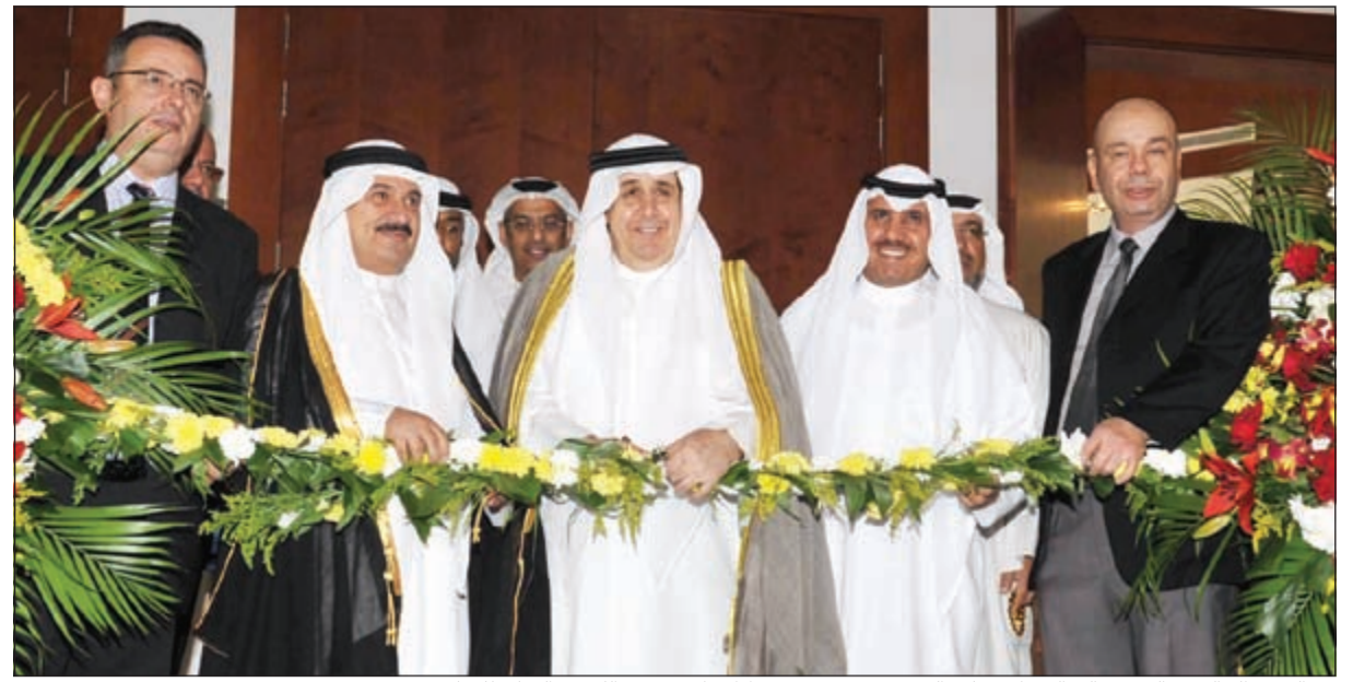
عبدالعزیز الخالدي والشيخ مالك الصباح ووليد القديومي يقصون شريط افتتاح معرض الكويت الدولي للعقار