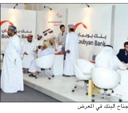
جناح البنك في المعرض

يشارك بنك بوبيان في معرض الكويت الدولي للعقار الذي انطلقت فعالياته أمس الاثنين بأرض المعارض، ويستمر حتى السبت المقبل، حيث سيقيم البنك باستعراض أبرز الخدمات والمنتجات التمويلية التي يقدمها لعملائه الشرائح. وتأتي مشاركة البنك في المعرض انطلاقاً من أهمية القطاع العقاري، حيث أنه وعلى الرغم من تنوع أدوات ومنتجات الاستثمار المختلفة أمام المستثمرين يظل للعقار أهميته الخاصة والتي تعرضت لها مختلف القطاعات الاقتصادية في الكويت والعالم. ويقوم موظفو البنك خلال المعرض بعرض مجموعة من مزايا تمويل المواد الإنشائية والتي تساعد العميل في الحصول على منزل أحلامه وتتضمن تمويلًا يصل حتى 70,000 دينار بمعدل أرباح تنافسي وتأمين دين مجاني يشمل إجمالي قيمة التمويل مع السرعة العالية والمرونة في إنهاء معاملة التمويل.