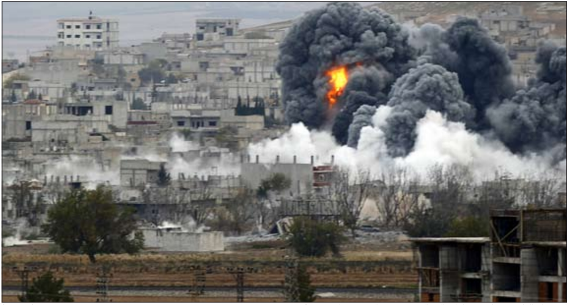
الانفجار الناتج من إحدى غارات التحالف في عين العرب شمال سورية

عن العرب «كوباني» دارت على إثره اشتباكات استمرت حتى صباح أمس. وذكر أن ما لا يقل عن 14 عنصراً على الأقل من التنظيم قتلوا إثر اشتباكات عنيفة دارت بين الطرفين في منطقة ساحة آزادي «الحرية» بالقرب من المركز الثقافي في المدينة وشمال المربع الحكومي الأمني وفي الحجة الجنوبية للمدينة إضافة إلى استحواذ وحدات حماية الشعب الكردي على أسلحة وتخزينها للتنظيم. ونقل المرصد عن مصادر موثوقة أن الاشتباكات العنيفة تواصلت أمس مستمرة في الجبهة الجنوبية ومنطقة البلدية وسوق الهال للمدينة بين الطرفين في حين قصفت قوات البشمركة العراقية التي تقاثل إلى جانب الأكراد السوريين نقاطاً تتركز لتنظيم الدولة الإسلامية في أطراف المدينة.