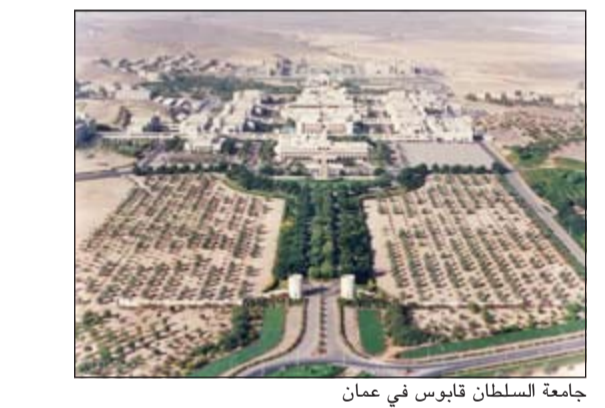
جامعة السلطان قابوس في عمان

يولي السلطان قابوس بن سعيد سلطان عمان اهتماماً بالغاً بالتراث العماني، ويوفر دعماً كبيراً ومستمراً للثقافة والأدب والفنون، محلياً وعربياً ودولياً، سواء من خلال منظمة اليونسكو أم غيرها من المنظمات الإقليمية والعالمية. وينبع هذا الاهتمام من الإيمان بأن المواطن العماني إنما يعبر عن ذاته وموروثاته وأنماط حياة أبائه وأجداده من خلال الثقافة بمختلف منتجاتها ووسائل التعبير عنها، وترجمة لهذه الرؤية الحكيمة السامية، تنوعت وتعددت الأنشطة والفعاليات الثقافية التي ترعاها وتنظمها السلطنة بمؤسساتها ووزاراتها الثقافية الكبير والمؤثر، ولتحقيق التفاعل والتواصل مع البيئة الثقافية الإقليمية والدولية. وتعد دار المخطوطات والوثائق من أبرز المشروعات الرائدة في هذا المضمار، حيث تضم بين جنباتها نحو 4300 مخطوط من مختلف فروع العلوم، حيث يقصدها عشرات الآلاف من الزوار من المواطنين والسياح من مختلف دول العالم. ومن أبرز المشروعات الثقافية التي رعاها السلطان قابوس على سبيل المثال لا الحصر: موسوعة السلطان قابوس للأسماء العربية، ودعمه مشروعات تحفيظ القرآن الكريم سواء داخل السلطنة أو في عدد من الدول العربية، إضافة إلى دعم عدد من الجامعات والمراكز العلمية العربية والدولية، فضلاً عن (جانزة السلطان قابوس لصون البيئة) التي تقدم كل عامين من خلال منظمة اليونسكو، ودعم مشروع دراسة طرق الحرير، وغيرها الكثير من المشروعات الأخرى.