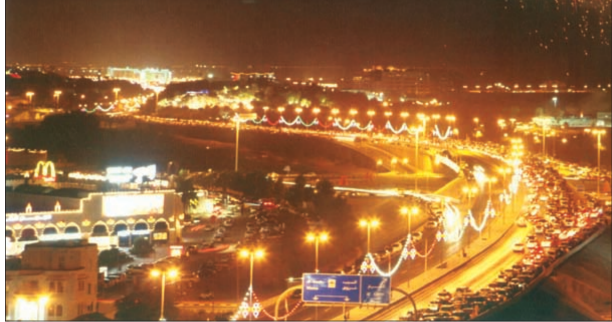
مسقط العامرة.. عراقة الماضي وحدثة الحاضر