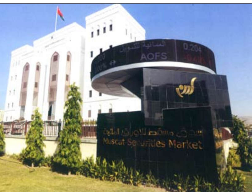
سوق مسقط للأوراق المالية.. صرح مالي يعكس الوعي الاستثماري للعمانيين

كما تضمنت خطط الدولة تزويد المستشفيات والمراكز الصحية المختلفة بأحدث التقنيات الطبية المتطورة لتواكب التطورات المتسارعة في المجال الصحي العالمي، كذلك حرصت على إعداد وتأهيل الكوادر الطبية من أطباء في مختلف التخصصات، وغيرهم من الكوادر المساعدة.