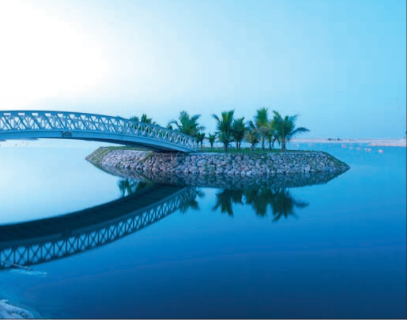
الشواطئ الخلابة على سواحل صلالة