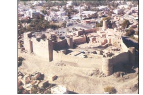
قناة بهلاء.. أبرز المعالم الأثرية في السلطنة

ولا شك أن النهضة الحديثة في سلطنة عمان ما كان لها أن تكون على هذا النحو المميز والدائم لولا جهود وعطاءات القيادة الحكيمة للسلطان قابوس، الذي لم يدخر جهداً من أجل رفعة السلطنة وتبويتها المكانة الرفيعة الملائمة