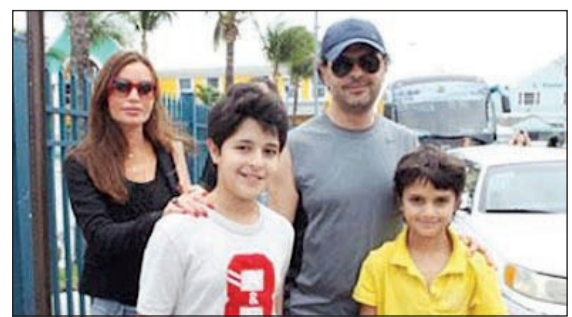
راغب علامة مع أسرته

أنهما يمارسان حياتهما بشكل طبيعي، كما أنهما لم يفكرا مطلقاً في الغناء أو احترافه. وكان راغب علامة قد نشر صورة على حسابه على موقع «انستغرام»، خلال غداء جمعة بابنيه في مطعم إيطالي، وكتب معلقاً عليها: «في غداء مع ملائكتي».