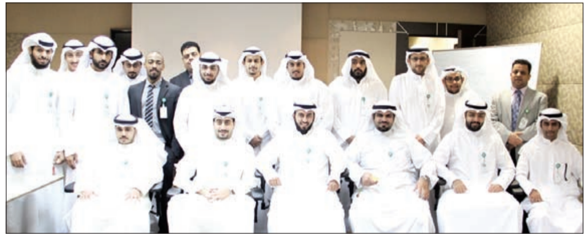
لقطة جماعية للمدربين

مركز الاتصال الإلكتروني. وتستمر البرامج التدريبية بما فيها التدريب على رأس العمل لمدة 3 أشهر مع التأكد من مدى الاستيعاب والقدرة على التطبيق العملي للحصول العلمي، ما يزيد المتدربين ثقة ويمتحنهم القدرة