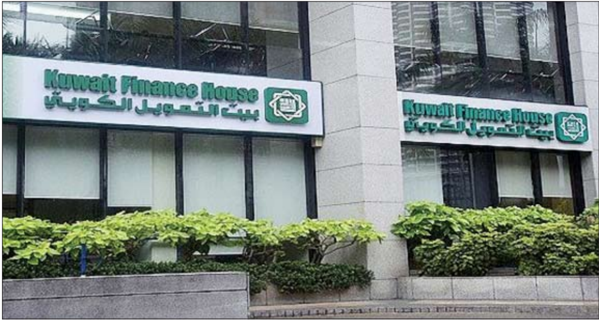
تثبيت التصنيف الائتماني لبيت التمويل الكويتي

وظهرت الإدارة بالنسبة للمعقارات والاستثمارات وأسواق رأس المال «شركات الواسطة وإدارة الأصول»، ما جعلها تظهر ككيانات منفصلة. وعند الانتهاء من تنفيذ خطة إعادة الهيكلة سيصبح لدى بيت التمويل الكويتي هيكل إداري أكثر تبسيطاً ومسؤولية وواضح مع زيادة وضوح المخاطر التشغيلية والائتمانية.