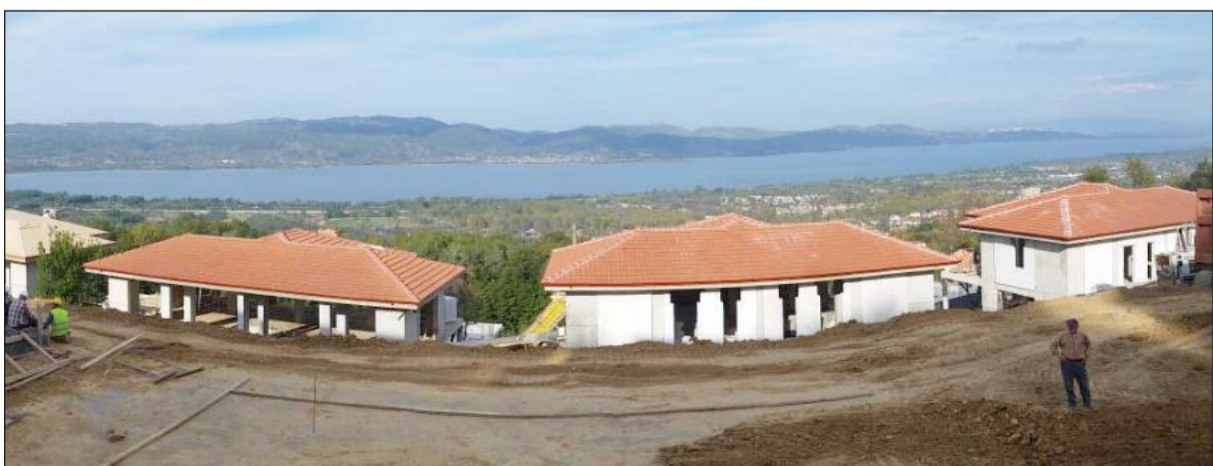
جانب من أعمال الإنشاء

جعلها من كبرى شركات التطوير العقاري في مدينة صنبجة - الجمهورية التركية، حيث تم إنجاز 3 مشاريع تتكون من 114 فيلاً وتسليمها