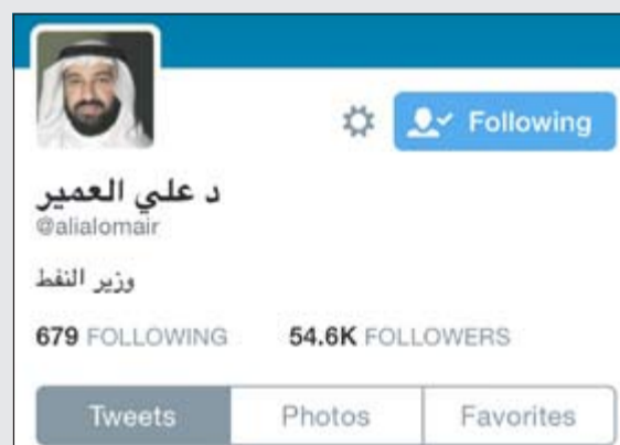
الوزير د.علي العمير الانشط تويتريا

الاجتماعي، لما لها من دور كبير ومتزايد في التواصل مع الجمهور. ومن خلال استعراضنا لمدى مواكبة الشركات النفطية لوسائل التواصل الاجتماعي الحديثة لا بد أن نشير هنا إلى قيادي القطاع النفطي الذي بدأ يشار إليهم بأنهم محترفو التغيير ويأتي في مقدمتهم وزير النفط ووزير الدولة لشؤون مجلس الأمة د.علي العمير الذي يتابع حسابه 54,7 ألف متابع يوميا عبر ما يزيد على 5 آلاف تغريدة منذ إنشائه الحساب في شهر ديسمبر 2010، وحساب الوزير العمير على تويتر يعتبر من أنشط الحسابات واشمها ليعتبر بذلك أول وزير نفط يفرد عبر تويتر بكل ما يهم الشارع الكويتي من أخبار ودحر إشاعات تروج من فترة لأخرى. ويعتبر الرئيس التنفيذي لشركة البترول الوطنية محمد غازي المطيري من القياديين النشطين على تويتر بعدد متابعين يتجاوز حاجز الـ 6 آلاف متابع عبر 7 آلاف تغريدة، يستعرض خلاله معلومات مختلفة بين القطاع النفطي والبترول الوطني ومعلومات تهم الجميع، ولم يقف المطيري عند ذلك الحد من التغريد بل يتلقى استفسارات وشكاوى العمال في الشركة ويحدد لهم مواعيد لزيارته والاستماع إلى شكاواهم. والاهتمام بوسائل التواصل