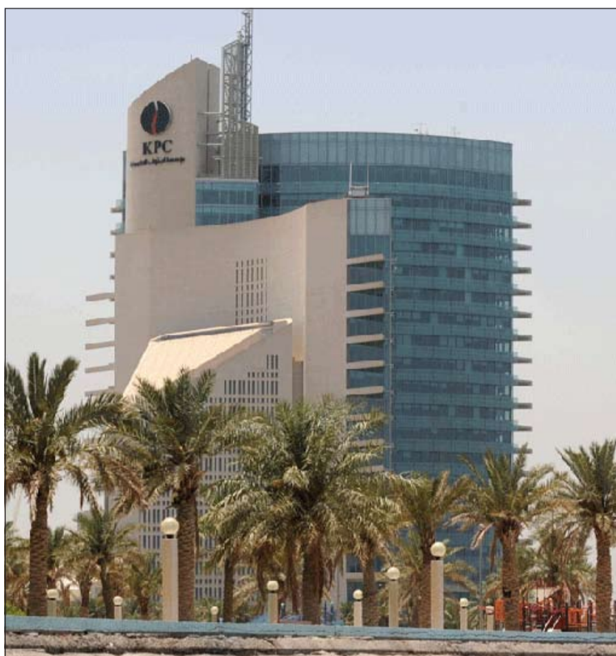
هل يتم اعتماد اللائحة المالية الجديدة لمؤسسة البترول الكويتية من قبل المجلس الأعلى للبترول؟

وكشفت اللائحة المالية الجديدة لمؤسسة البترول، والتي حصلت «الأنباء» على نسخة منها، أن المادة الأولى محل التعديل تعتبر المادة الأخطر والأساسية في التعديل، حيث أن تعديلها يترتب عليه دخول حسابات الشركات الخارجية مثل «كوفيتك- والبترول العالمية» والشركات المنبثقة منها خارجياً في الميزانية، حيث بناء على اللائحة القديمة كانت النتائج المالية السنوية لتلك الشركات لا تدخل في