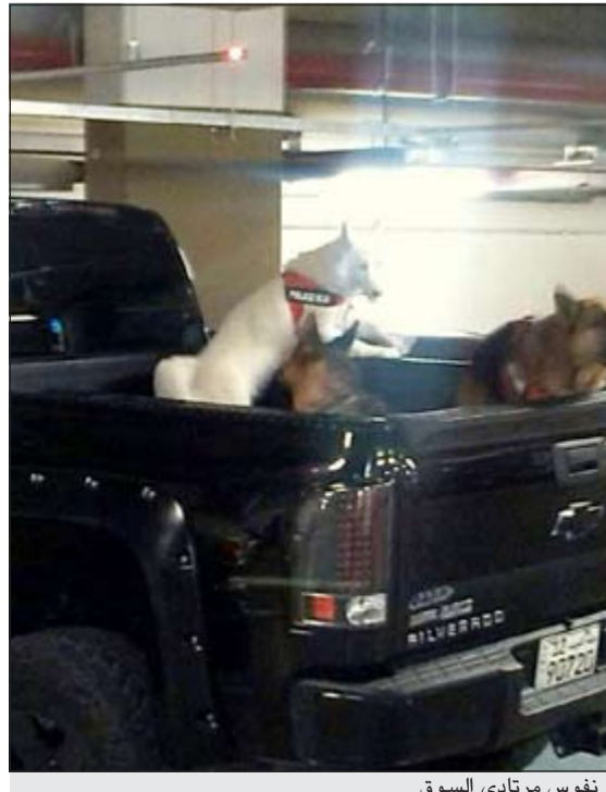
الكلاب أثارت الخوف في نفوس مرتادي السوق

محمد الدشيش -محمد الجلاهة اتهمت صاحبة صالون نسائي في منطقة الرقعي مواطنة باتلاف ديكور الصالون الخاص بها. وقالت المبلغة ان الزبونة دخلت الى الصالون وطلبت تقصير شعرها وعمل قصة شاهدها في اليوم، واضافت المبلغة: بعد ان انتهت مصففة الشعر من تنفيذ رغبة الزبونة، ابدت الزبونة اعتراضا على القصة واخذت تكيل