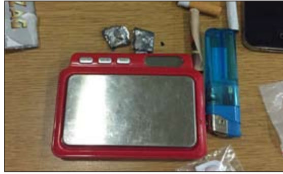
سجائر ملغمة بالحشيش وقطعة حشيش قبل التفتيش