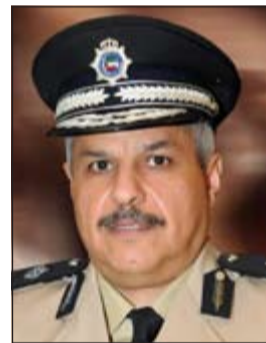
اللواء الشيخ مازن الجراح

أعلن وكيل وزارة الداخلية المساعد لشؤون الجنسية والجوازات اللواء الشيخ مازن الجراح عن إصدار الأمر الإداري رقم (17/2014) بشأن تشكيل فريق تفتيش بإشراف عام الإدارة العامة لشؤون الإقامة بالإناث اللواء طلال معرفي للقيام بحملات تفتيشية مفاجئة على مكاتب استقدام العمالة المنزلية لضبط أي مخالفات من جانب هذه المكاتب، وأشار إلى أن فريق التفتيش سيقوم بإبعاد كل من يقوم بمخالفة القوانين، وكذلك اتخاذ اللازم بحق مكاتب استقدام العمالة