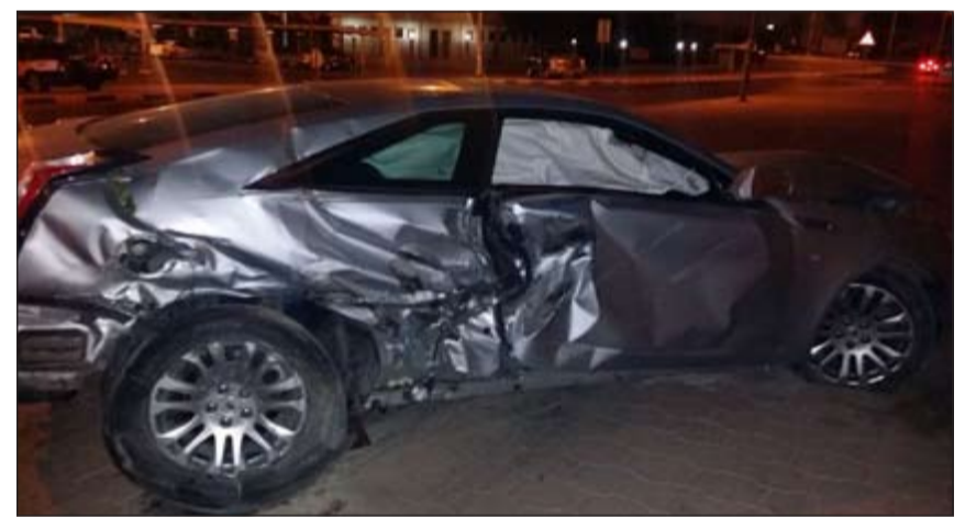
حادث التعاون قتل شابا واتلف مركبته

من جهة اخرى، احتجز سائق باكستاني في مخفر القشعانية وتركت جثة شاب للطب الشرعي ونقل مواطن شاب الى مستشفى الجهراء وذلك بعد تصادم بين مركبة الشابين بنساف كان يقوده الباكستاني على طريق القشعانية وسجلت قضية تصادم ووفاة.