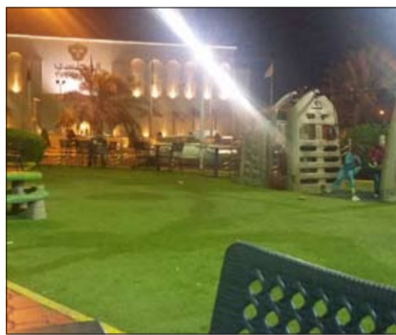
احدى السيارتين استقرت على بعد امتار من حديقة العباب احد المطاعم