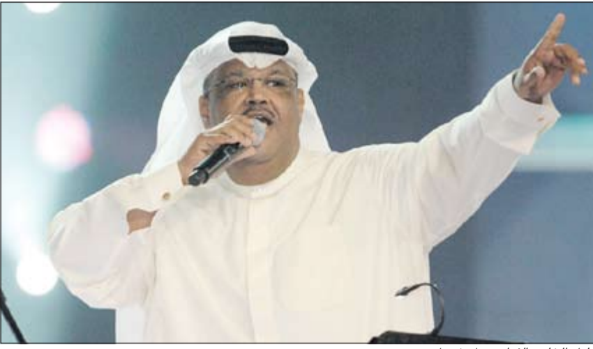
نبل الخليج الفنان نبيل شجيل