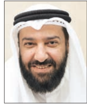
د. علي العمير

أشاد وزير النفط ووزير الدولة لشؤون مجلس الأمة د. علي العمير بجهود مؤسسات الدولة المعنية بتنفيذ مشاريع برنامج الكويت لمعالجة البيئة الخاصة بمشاريع التعويضات البيئية الصادرة عن المجلس الحاكم للجنة الأمم المتحدة للتعويضات بموجب القرارين 269 و271. وأكد العمير الذي يشغل أيضا منصب رئيس مجلس إدارة نقطة الارتباط الكويتية لمشاريع البيئة «كويت أن أف بي» من أهمية استمرار مؤسسات الدولة بجهودها الكفيلة بتنفيذ الالتزامات الوطنية تجاه المنظمة الدولية بموجب الضمانات المقدمة من الكويت بهذا الخصوص تأهلا للبيئة الكويتية وتحقيقا للاستدامة البيئية المرجوة. وأشار إلى أهمية مشاريع التعويضات البيئية نظرا لضرورة تأهيل بعض المواقع في الدولة المحددة ضمن برنامج المعالجة البيئية خاصة بعد نقل البرنامج البيئي الممول من قبل الأمم المتحدة إلى الإشراف الوطني للكويت من خلال نقطة الارتباط الكويتية لمشاريع البيئة. وشدد على أن شفافية الكويت في تنفيذ هذه المشاريع