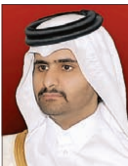
الشيخ عبدالله بن حمد بن خليفة آل ثاني

قنا: أصدر أمير قطر الشيخ تميم بن حمد آل ثاني أمراً أميرياً أمس عين بموجبه أخاه الشيخ عبدالله بن حمد آل ثاني نائباً له. وقالت وكالة الأنباء القطرية إن الشيخ تميم أصدر «الأمر الأميري رقم (4) لسنة 2014 بتعيين الشيخ عبدالله بن حمد آل ثاني نائباً لأمير دولة قطر». وقضى الأمر أن يعمل به من تاريخ صدوره وأن ينشر في الجريدة الرسمية، بحسب الوكالة.