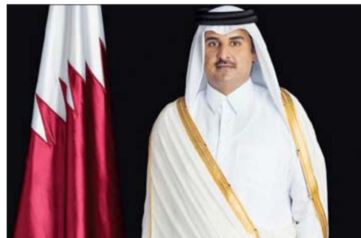
أمير دولة قطر الشيخ تميم بن حمد آل ثاني (قنا)