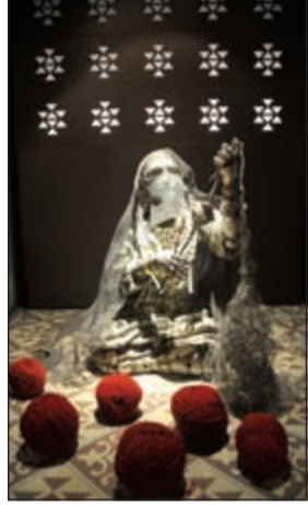
المرأة الكويتية قديما