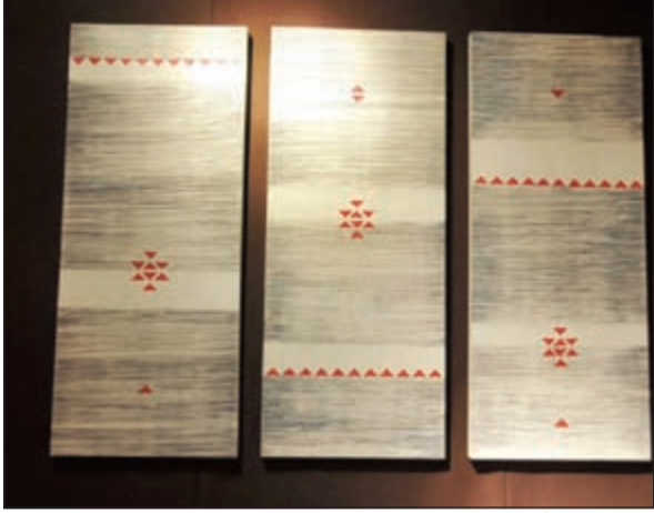
تابلو يعكس أصالة التراث الكويتي