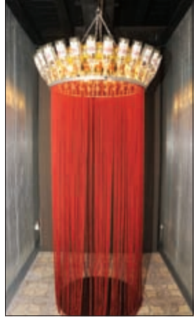
منتجات بسيطة لكنها مبدعة