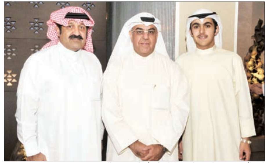
الشيخ أحمد اليوسف والشيخ جابر فيصل الصباح وأحد الحضور في المعرض

أشجار خلال افتتاح اليوم الأول له إلى أنه يضم إكسسوارات وهدايا عصرية تجمع بين الحرفية والإبداع