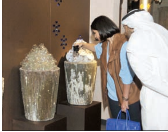
جولة داخل المعرض