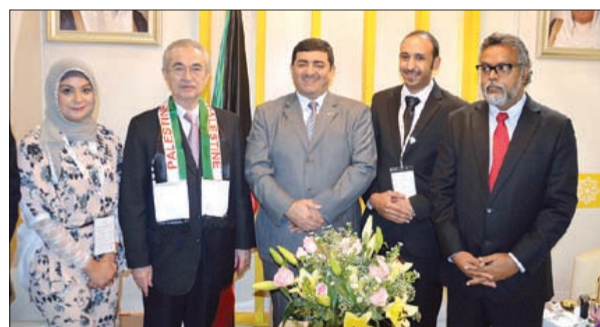
السفير سعد العسوسى لدى زيارته المعرض التجاري الدولي لمنظمة التعاون الإسلامي في ماليزيا

القفاقي والتجاري. ولفت إلى ان سفارتنا لدى ماليزيا كانت حريصة على حث المسؤولين في وزارة التجارة والصناعة الكويتية على المشاركة في أنشطة هذا المعرض المهم الذي يحتضن عددا كبيرا من الشركات المختلفة، وأعرب عن شكره وتقديره للجهود التي بذلتها وزارة التجارة والصناعة الكويتية من خلال مشاركتها في أنشطة المؤتمر والمعرض التجاري الدولي لمنظمة التعاون الإسلامي.