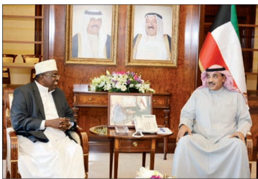
الشيخ صباح الخالد مستقبلاً سفير كينيا لدى الكويت محمد مهات

استقبل صاحب السمو الأمير الشيخ صباح الأحمد بقصر بيان صباح أمس رئيس مجلس الأمة مرزوق الغانم. واستقبل صاحب السمو الأمير الشيخ صباح الأحمد بقصر بيان صباح أمس نائب رئيس مجلس الوزراء وزير الدفاع الشيخ خالد الجراح، حيث قدم لسموه الفريق الركن محمد خالد الخضر وذلك بمناسبة تعيينه رئيساً للأركان العامة للجيش، والفريق الركن الشيخ عبدالله نواف الأحمد وذلك بمناسبة تعيينه نائباً لرئيس الأركان العامة للجيش. وحضر المقابلة نائب وزير شؤون الديوان الأميري