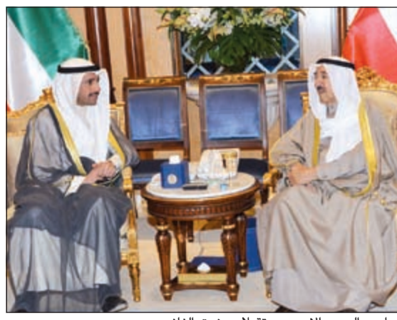
صاحب السمو الامير مستقبلاً مرزوق الغانم

تنفيذاً للمرسوم الأميري الصادر من صاحب السمو الأمير القائد الأعلى للقوات المسلحة الشيخ صباح الأحمد وبحضور نائب رئيس مجلس الوزراء ووزير الدفاع الشيخ خالد الجراح ورئيس الأركان العامة للجيش الفريق الركن محمد الخضر ووكيل وزارة الدفاع جبار الجزار أقيمت صباح أمس في ديوان اللواء الركن عبدالله النواف إلى رتبة فريق وتعيينه نائباً لرئيس الأركان العامة للجيش. ويهدف المناسبات التي أقيمت صباح أمس في ديوان الجراح كلمة هنا فيها نائب رئيس الأركان العامة للجيش على الثقة الغالية التي أولاها إياه صاحب السمو الأمير، متمنياً له التوفيق والنجاح في مهام عمله بالمنصب الجديد.