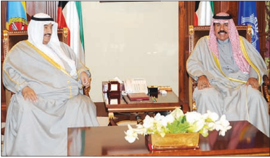
سمو ولي العهد الشيخ نواف الأحمد مستقبلاً سمو الشيخ ناصر المحمد

استقبل سمو ولي العهد الشيخ نواف الأحمد بقصر بيان صباح أمس سمو الشيخ ناصر المحمد. واستقبل سمو ولي العهد بقصر بيان صباح أمس نائب رئيس مجلس الوزراء ووزير الدفاع