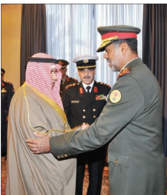
الشيخ خالد الجراح مصافحاً الفريق الركن الشيخ عبدالله النواف

تنفيذاً للمرسوم الأميري الصادر من صاحب السمو الأمير القائد الأعلى للقوات المسلحة الشيخ صباح الأحمد وبحضور نائب رئيس مجلس الوزراء ووزير الدفاع الشيخ خالد الجراح ورئيس الأركان العامة للجيش الفريق الركن محمد الخضر ووكيل وزارة الدفاع جبار الجزار أقيمت صباح أمس في ديوان اللواء الركن عبدالله النواف إلى رتبة فريق وتعيينه نائباً لرئيس الأركان العامة للجيش. ويهدف المناسبات التي أقيمت صباح أمس في ديوان الجراح كلمة هنا فيها نائب رئيس الأركان العامة للجيش على الثقة الغالية التي أولاها إياه صاحب السمو الأمير، متمنياً له التوفيق والنجاح في مهام عمله بالمنصب الجديد.