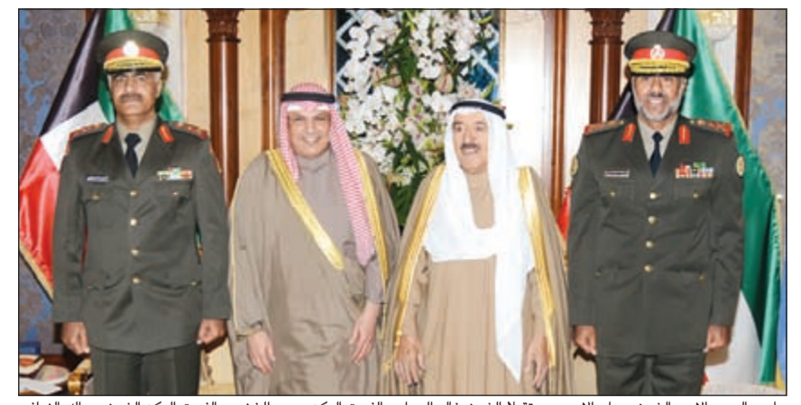
صاحب السمو الامير الشيخ صباح الاحمد مستقبلاً الشيخ خالد الجراح والفريق الركن الشيخ عبدالله النواف