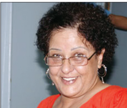
الفنانة الراحلة معالي زايد