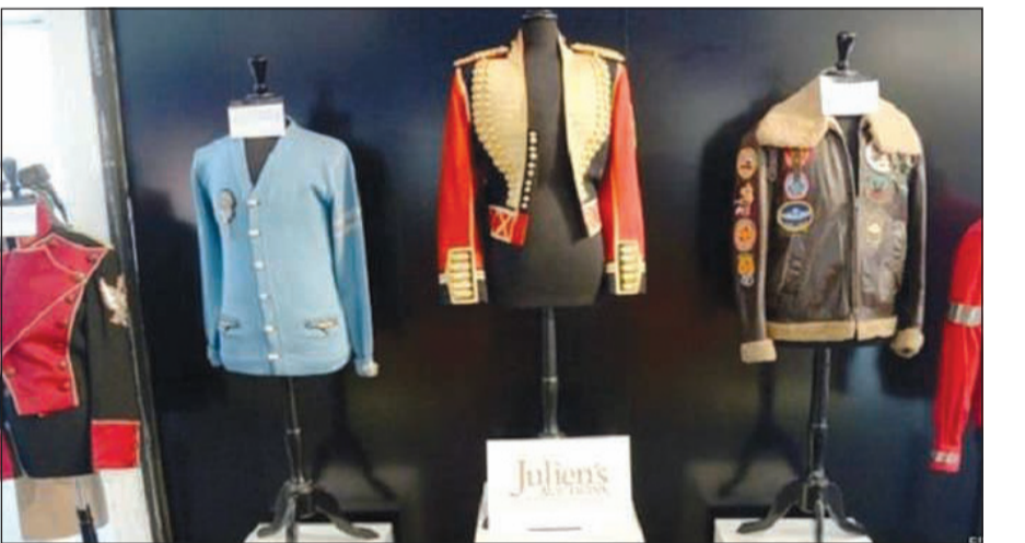
الملابس تم بيعها في مزاد علني

هوليوود معطف ارتدته في فيلمها «الاستماتة في البحث عن سوزان»، إذ وصل سعره إلى 252 ألف دولار في حين بيع نوب ارتدته في فيديو أغنية «الفتاة المادية» بـ 73125 دولار.