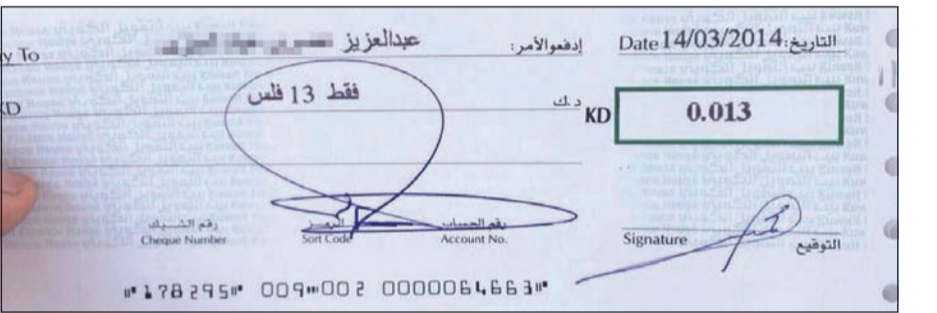
الشيك كان محل جدل واسع على وسائل التواصل

النشطاء اعتبروا في تغريدات عدة أن كلفة الشيك الصادر لصالح المواطن تفوق قيمة المبلغ المدون به، كما أن المواطن حال قيامه بمغامرة لصرف الشيك سيكتلف بنزينا ووقتا يعادل 1000 ضعف على أقل تقدير.