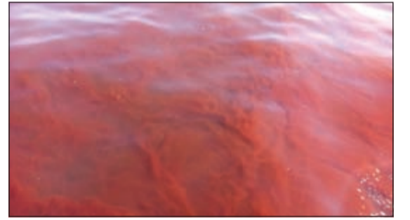
ظاهرة المد الأحمر

في مختبرات الهيئة ومعهد الكويت للأبحاث العلمية أن النوع المسبب هو من أنواع الطحالب غير الضارة يعرف بـ (ميريونكتا روبرا) مبينا أن اللون الأحمر يرجع إلى الصبغات الحمراء اللون المعروفة (فايكوايريترين). وأفاد بأنه نسبة لكثافة الطحلب المزدهر تشير التحاليل الجارية التي انخفضها أمس عما كانت عليه في يوم السبت الماضي مضيفاً أن زوارق هيئة البيئة ستستمر في المسوح اليومية لتابعة هذه الظاهرة إلى حين التأكد من اختفائها تماماً.