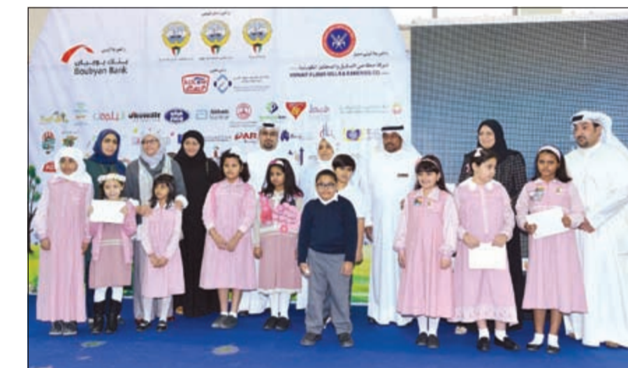
الوزيرة هند الصباح مع الفائزين

في فعاليات قطار الأفتونوز الشهر الماضي وعلى مستوى الشباب قام برعاية مجموعة من مشاريع التخرج بكلية الهندسة والبتترول والعديد من المهرجانات والأنشطة لكافة شرائح المجتمع. ويقدم بنك بوبيان حساب الغالي والذي يمنح أبناء عملاء البنك مزايا استثنائية تجعلهم مميزين مقارنة بحسابات الأطفال المثيلة أبرزها الحصول على أرباح شهرية تنافسية تعادل ضعف