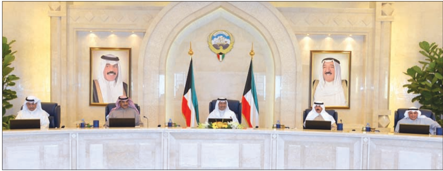
سمو رئيس مجلس الوزراء الشيخ جابر المبارك مترشدا اجتماع بحضور الشيخ صباح الخالد والشيخ محمد الخالد والشيخ خالد الجراح ود. عبدالمحسن المدعج

والتسويات في الاقتصاد المحلي وذلك من حيث تقييم أداء وفعالية هذه النظم بصفتها من العوامل المهمة في إطار عملية تحقيق الاستقرار المالي كما ناقش التقرير العديد من التطورات التي شهدتها الاقتصاد الكويتي في عام 2013 وبصفة خاصة التطورات ذات الصلة بالاستقرار المالي كما قام البنك المركزي بنشر هذا التقرير في موقعه الإلكتروني في إطار المنهجية التي يطبقها بشأن تعزيز الشفافية لما يقوم به من إجراءات وتطوير ما لديه من سياسات وأدوات تستهدف صيانة الاستقرار النقدي والاستقرار المالي في البلاد.