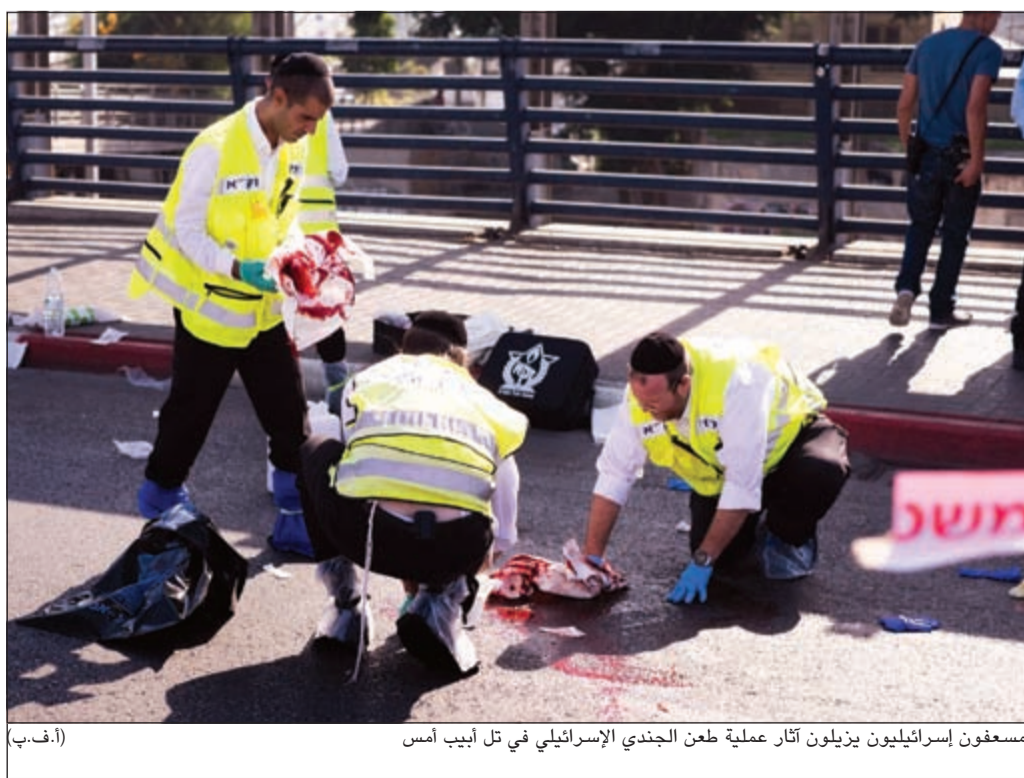
مسعفون إسرائيليون يزيلون آثار عملية طعن الجندي الإسرائيلي في تل أبيب أمس