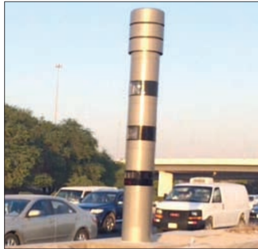
كاميرات جديدة للسرعة على طريقي الدائريين الخامس والسادس