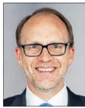
السفير دوغلاس سيليمان

وفي تصريحات خاصة لـ «الانباء» ورداً على سؤال حول الإجراءات التي تنتظر في فايز الكندري المعتقل في غوانتانامو وخصوصاً بعد الإفراج عن فوزي العودة، لفت سيليمان إلى أن الحكومة الأميركية ليس لديها أي وقت زمني محدد يتعلق بنقل محتجزين معينين من معتقل غوانتانامو، إلا أنها ملتزمة بتقليل عدد المحتجزين وإغلاق المعتقل بشكل مسؤل، مشيراً إلى انعقاد اجتماعات لجنة المراجعة الدورية بشكل معتاد. ورداً على سؤال حول مدى تحول الرئيس السوري بشار