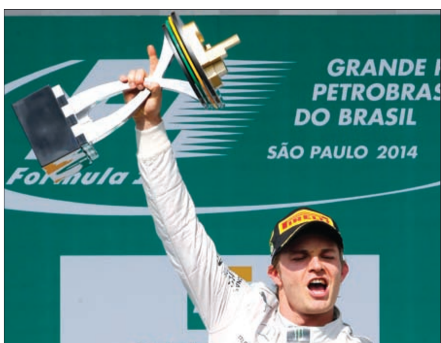
الألماني نيكو روزبرغ يحتفل بفوزه على منصة التتويج

ليشعل فنتيل المنافسة في الجولة الأخيرة في ابوظبي والتي ستكون نقاطها مضاعفة (50 نقطة للفائز). ويكفي هاميلتون احتلال المركز الثاني (36 نقطة) في ابوظبي للتتويج باللقب العالمي الثالث بعد الأول عام 2008 مع ماكلاين مرسيدس، أما إذا حل ثالثا (30 نقطة) فإن اللقب سيعود إلى روزبرغ في حال تتويجه بلقب سباق ابوظبي. وانهى روزبرغ السباق بزمن 1,30,02,555 ساعة بمعدل سرعة وسطي بلغ 203,843 كلم في الساعة، متقدما على هاميلتون بفارق 1,457 ثانية، وماسا بفارق 41,031 ث.