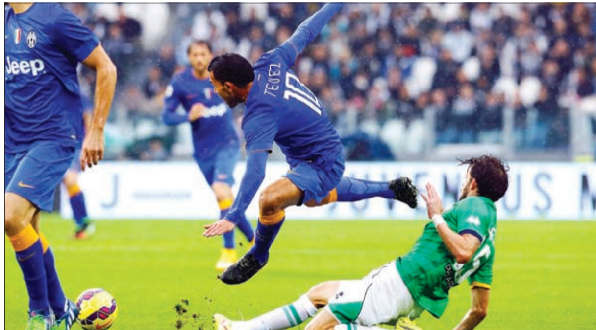
مهاجم يوفنتوس كارلوس تيفيز يتعرض للتعرقلة من مدافع بارما اندريا كوستا

انتشر العديد من التكهنات حول مستقبل الألماني ماركو ريوس لاعب بروسيادورتموند خلال الفترة المقبلة. صحيفة الدلي ستار البريطانية أشارت إلى أن أندية مان يونايتد، وأرسنال وليفربول يسعون للتعاقد مع ماركو ريوس صاحب الـ 23 هدفا في 43 مباراة الموسم الماضي، خلال فترة الانتقالات الشتوية. وأضافت الصحيفة أن ثلاثي الدوري الإنجليزي على استعداد لدفع 20 مليون جنيه إسترليني من أجل ضم الدولي الألماني، والذي نال اهتمام العديد من الأندية الكبرى في أوروبا. وأفادت الصحيفة أيضا بأن الأندية الإنجليزية ستعاني بشدة لإتمام تلك الصفقة في حالة دخول نادي ريال مدريد الإسباني في مفاوضات جديدة من أجل ضم اللاعب خلال الفترة المقبلة.