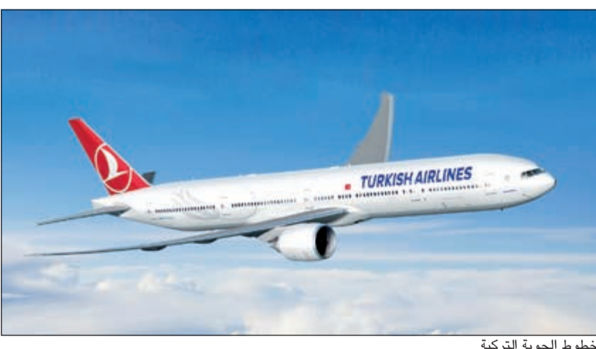
الخطوط الجوية التركية

الذي يليها. كما سيحصلون على تذكرة موسم ضيافة كبار الشخصيات في فندق «ماكس رويال»، يشار إلى أن الخطوط الجوية التركية قد شهدت نوا سريعا خلال الأعوام العشرة الأخيرة، وتسير رحلاتها الآن إلى 261 وجهة حول العالم، بما فيها 218 وجهة دولية و43 وجهة محلية في 108 بلدان. وبحسب استطلاع رأي «سكاي ترافكس» الذي يعرف أيضا بـ «جوائز اختيار المسافرين» لعام 2014، تم اختيار الخطوط الجوية التركية «أفضل شركة طيران في أوروبا» للعام الرابع على التوالي، و«أفضل شركة طيران في جنوب أوروبا» للعام السادس على التوالي. كما حصلت الخطوط الجوية التركية، التي فازت بجائزة «أفضل خدمة طعام على متن الدرجة السياحية» في العالم فسي 2010 وجائزة «أفضل خدمة طعام على متن درجة رجال الأعمال» في العالم 2013، على جائزتي «أفضل خدمة طعام على متن درجة رجال الأعمال» و«أفضل خدمة طعام في صالة سفر درجة رجال الأعمال» في العالم لهذا العام ضمن استطلاع «سكاي ترافكس».