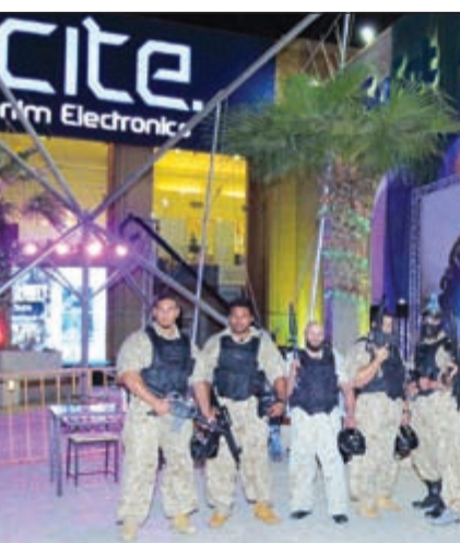
من حفل الإطلاق

اللعبة أثناء تسليقهم صعودا وهبوطا، ومع كل تصويب صحيح يحصل المتسابق على نقطة، وفي النهاية يتم جمع النقاط للوصول إلى الفائز الذي حصل على هدية قيمة من «X-سايه»، وقد لقي الاحتفال صدى كبيرا على مواقع التواصل الاجتماعي في الكويت مما أوضح مدى الشعبية التي تحظى بها هذه اللعبة.