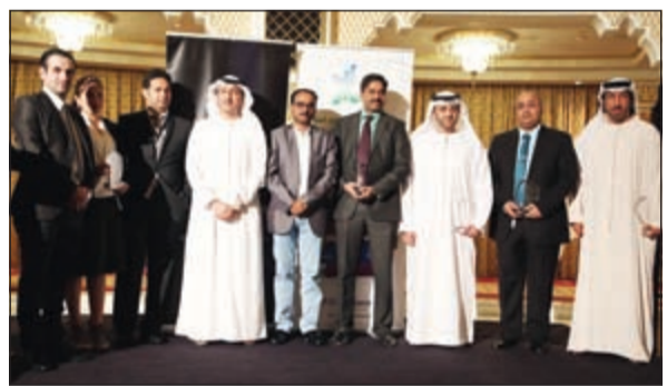
لقطة جماعية للمحرمين