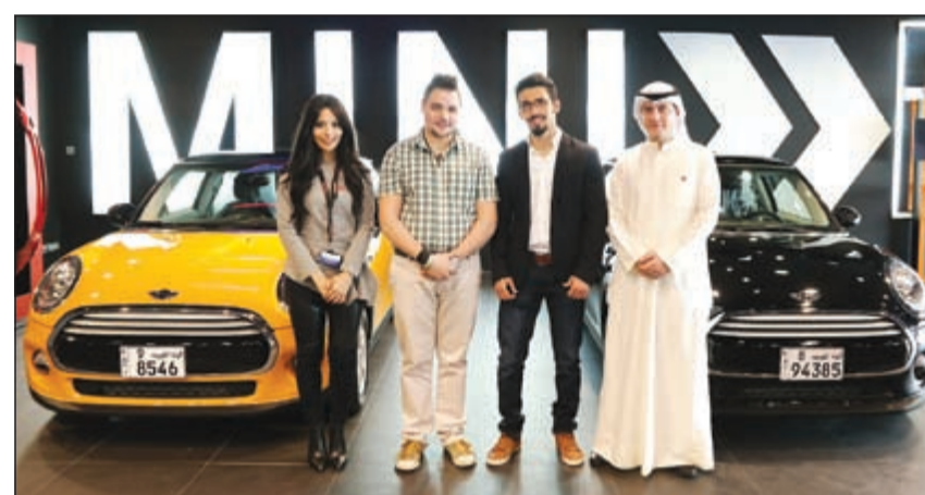
ممثلو Ooredoo مع الفائزين

مبادرات مماثلة في المستقبل مبنية على تحقيق تطلعات الأفراد. وكانت الشركة قد دشنت حملة I WANT الترويجية للتعريف بالعلامة التجارية Ooredoo، وذلك عن طريق موقع خاص بالحملة على شبكة الإنترنت ومواقع مخصصة للحملة في عدد من المجمعات التجارية في مختلف مناطق الكويت.