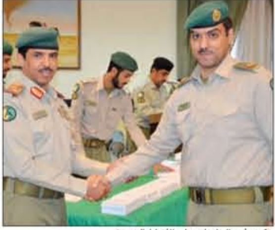
تكريم أحد الحاصلين على الأنواط الجديدة

وأضاف أننا نحتفل بحملة الأنواط الجديدة ونحن نقف أمام لوحة مضيئة من الإنجازات التي حققتها قيادة الإسناد في مساندة أجهزة الدولة وتعميق التعاون مع المجتمع المدني انطلاقاً من واجب المسؤولية المجتمعية، حيث بات الحرس الوطني يحظى بمكانة متميزة بفضل توجيهات قيادتنا الرشيدة، وفي ختام كلمته دعا العميد الركن فالح شجاع المكرمين إلى الاستمرار في بذل الجهود وصولاً إلى تحقيق الإبداع كل في مجال عمله.