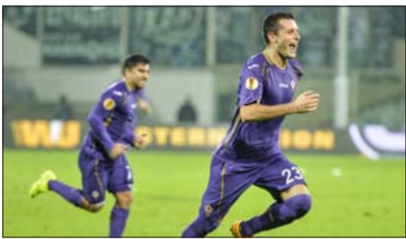
فكرة لاعبي فيورنتينا بهدف التعادل في مرمى باوك

كما تاهل فيورنتينا الإيطالي بتعاهله مع ضيفه باوك اليوناني 1-1 ضمن منافسات المجموعة الحادية عشرة، ورفع فيورنتينا رصيده إلى 10 نقاط بعد أن كان فاز في مبارياته الثلاث الأولى. وفي مباراة ثانية، فاز غانغان الفرنسي على دينامو