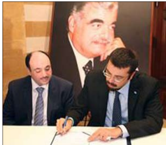
احمد الحريري ونواف البوس خلال الاحتفالية

المنطقة في بلداتهم إضافة إلى تحريك العجلة الاقتصادية. واعرب عن تقديره للدور الذي تؤديه الكويت قيادة وحكومة وشعباً في دعم لبنان بمختلف الظروف لافتاً إلى أهمية المنحة التي قدمتها الكويت بعد حرب عام 2006 وخصصت لتنمية العديد من القطاعات الاقتصادية في لبنان. من جانبه تقدم النائب اللبناني معين المرعي في تصريح لـ «كونا» بالشكر باسم اهالي «عكار» وكل اللبنانيين إلى الكويت اميرا وحكومة وشعباً على دعمها غير المحدود لمسيرة التنمية في لبنان، بدوره ثمن النائب خضر حبيب دور الصندوق الكويتي للتنمية في دعم المشاريع