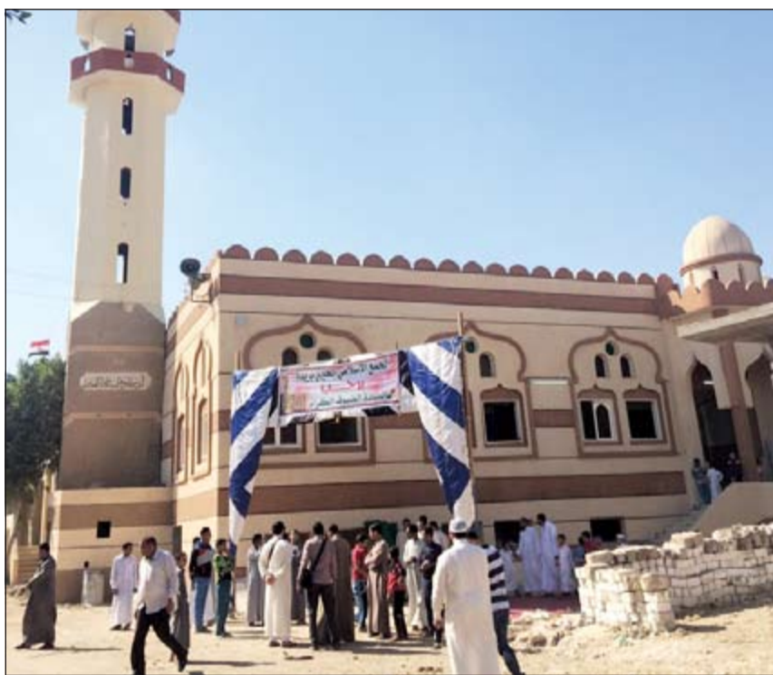
أحد المجمعات التي تم افتتاحها بالمنيا