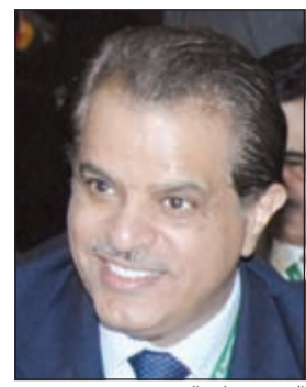
السفير علي السعيد

موناكو - كونا: أشاد سفيرنا لدى فرنسا علي السعيد بنتائج وتوصيات اجتماعات منظمة الشرطة الجنائية الدولية (إنتربول) التي اختتمت في موناكو بمشاركة الكويت ودورها المهم في تنسيق الجهود المشتركة لمكافحة الجريمة المنظمة بجميع أشكالها وصورها. وقال السعيد ان الكويت كان لها حضور فاعل في تلك الاجتماعات عبر وفد امثي رفيع المستوى برئاسة نائب رئيس مجلس الوزراء ووزير الداخلية الشيخ محمد الخالد. وأضاف ان الشيخ محمد الخالد عقد على هامش الجمعية العامة لمنظمة الإنتربول سلسلة من اللقاءات «المهمة والبناءة» مع وزراء ومسؤولي عدد من الدول الأعضاء في الإنتربول بهدف توثيق التواصل والتعاون الثنائي على الصعيد الأمني. وحول احتفال منظمة الإنتربول بذكرى 100 عام على تأسيسها، أكد السعيد أهمية الدور الذي تضطلع به المنظمة منذ نشأتها في تقديم الدعم والمساعدة لدولها الأعضاء عبر تبادل الخبرات والمعلومات لمكافحة الجريمة بشتى أنواعها على الصعيد الإقليمي والدولي. وقال ان الكويت حريصة على التواصل المستمر والمشاركة في جميع أنشطة واجتماعات منظمة الإنتربول سواء التي تتعقد في مقرها الرئيسي في مدينة ليون الفرنسية أو خارجها. وأوضح السعيد ان الاجتماع الوزاري الذي حضره 88 وزير داخلية وممثلون عن 160 دولة بحث السبل الكفيلة بالتصدي لتهديدات الجريمة