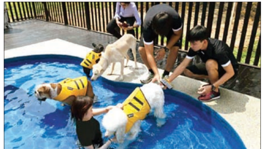
نزلاء الفندق من الكلاب في حمام السباحة