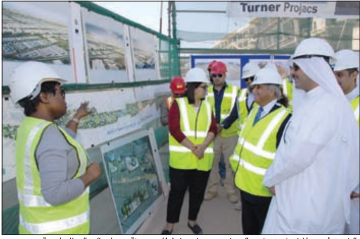
الشيخ أحمد المشعل يستمع إلى شرح حول مخططات مدينة صباح السالم الجامعية