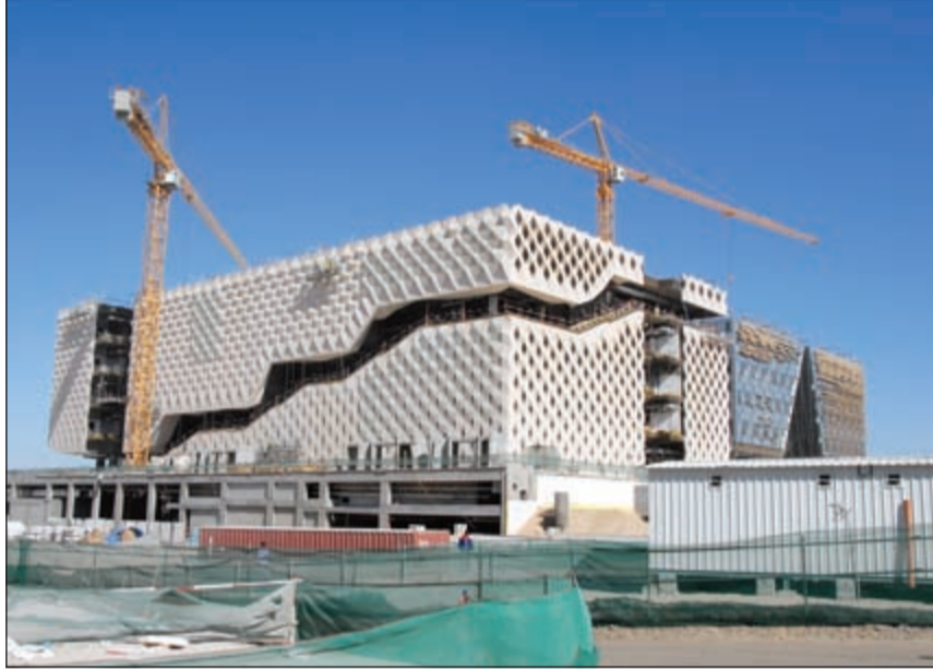
جانب من منشآت مدينة صباح السالم الجامعية