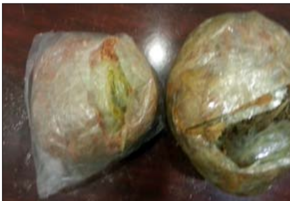
الاطعمة وقد اخفي البنغالي المخدرات بداخلها