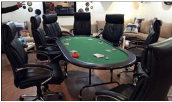
الغيايا أعدت كصالة للقمار

أبلغت مواطنة مخفر هدية عن تغيب ابنها البالغ من العمر 15 عاماً مشيرة إلى ان ابنها خرج من منزل العائلة في الأول من الشهر الجاري، من جهة أخرى أبلغ بنغالي مخفر هدية عن تعرضه للضرب من قبل سائق تاكسي جوال، وسجلت قضية اعتداء بالضرب.