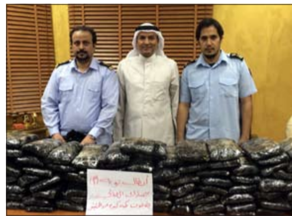
رجال الجمارك يلتقطون صورة تذكارية امام المخدرات المضبوطة

المخدرات، والذي نقل اليها بناء على اوامر من مدير عام الإدارة العامة للجمارك بالانابة خالد السيف، أقر بأنه جلب المواد المخدرة بقصد تهريبها الى دول خليجية أخرى. وكان رجال منفذ العبدلي