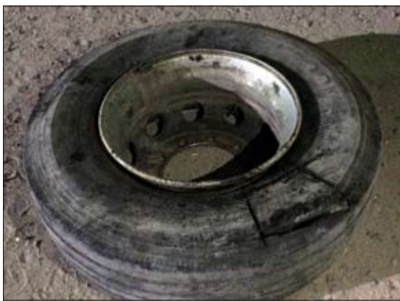
الحشيش اخفي في الاطار الاحتياطي وضبط في العبدلي

اشتبهوا في شخص خليجي قدم من العراق مستغلاً بأصا. حيث تم اخضاع الباص للتفتيش الدقيق وتبين ان الخليجي اخفي 104 كيلوات حشيش في الاطار الاحتياطي للباس.