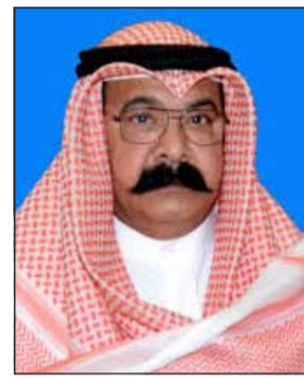
اللواء محمود الطباخ

مواطن وانه يقدم خدمات لعب القمار بمقابل مالي، وضبط داخل صالة القمار مبلغ مالية كبيرة وهي عملات كويتية وأجنبية، وكاشير لاستبدال الأقيشات بالمال. وقال مصدر أمني إن معلومات بشأن استغلال فيلا في لعب القمار وصلت إلى مدير عام الإدارة العامة للمباحث الجنائية اللواء محمود الطباخ الذي أمر إدارة مباحث الآداب بقبادة العميد محمد الشرهان والذي