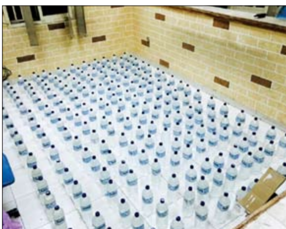
.. والخمر المحلية المضبوطة في الاحمدي

زجاجات مياه استبدلت بالخمر، وقال مصدر أمني أن رجال أمن الجليب شاهدوا وأفاد يحمل كيساً ولدى الطلب منه التوقف انطلق مسرعاً في ساحة ترابية لتتسم ملاحقته من قبل رجال الأمن وضبطه واثنتين آخرين كانا يبيعان الخمر المحلية على الآسيويين، وتم التحفظ على الوافدين والمضبوطات.