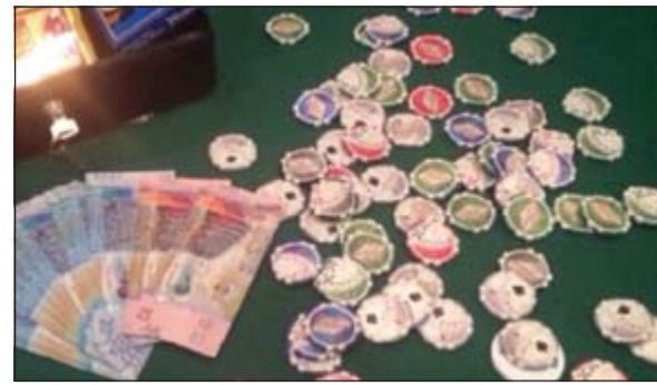
جانب من المبالغ المضبوطة وأدوات الفيش المستخدمة