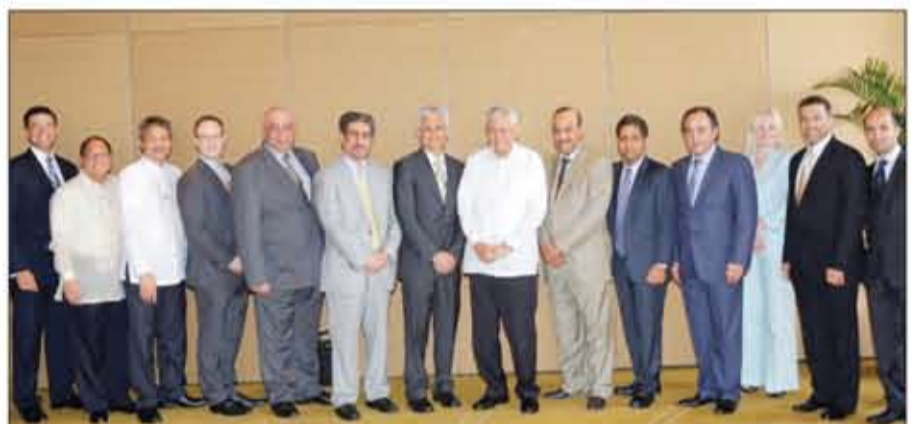
جانب من زيارة المجلس الاستشاري لصندوق الوائس مؤخراً إلى الفلبين