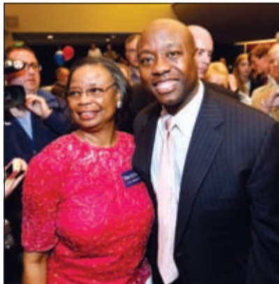
السيناتور الأسود تيم سكوت يحتفل بفوزه بمقعد عن ولاية كارولينا ليصبح أول أسود ينتخب في الولاية الجنوبية التي انصلقت منها حرب الانفصال قبل نحو قرنين