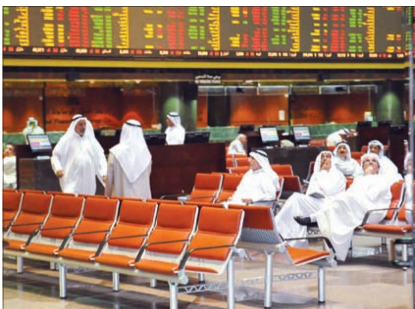
بورصة الكويت.. عزوف وخسائر واللون الأحمر سيطر على المؤشرات ووجوه المتداولين