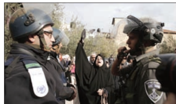
سيدة فلسطينية تصرخ في وجه جنود إسرائيليين قرب إحدى بوابات المسجد الأقصى بالقدس أمس

عواصم - وكالات: تصاعدت وتيرة الأحداث في القدس الشرقية أمس على وقع الاعتداءات الإسرائيلية المتكررة على المسجد الأقصى المبارك. فقد قتل شرطي إسرائيلي وأصيب عشرات آخرون بعد