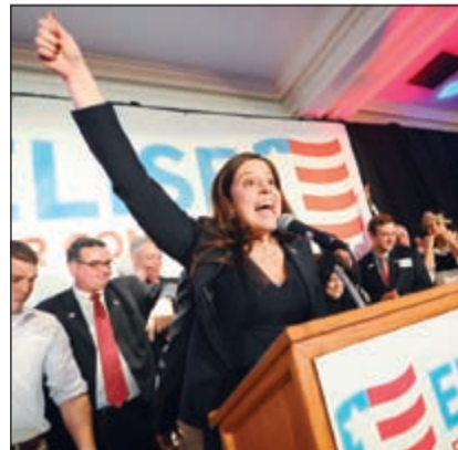
المرشحة اليزبي ستيفانيك تحتفل بفوزها بمقعد نيويورك لمجلس النواب لتصبح أصغر عضو في الكونغرس ولم تتجاوز 30 عاماً (أ.ب)

واشنطن - وكالات: وجه الجمهوريون ضربة قوية للرئيس الديموقراطي باراك أوباما في انتخابات التجديد النصفي للكونغرس، ستجعل من السنيتين الباقيتين له في البيت الأبيض صعبتين للغاية وربما تجبره على إدخال بعض التعديلات في سياسته والبحث عن انطلاقة جديدة، فقد انتزعوا نحو 7 مقاعد كانت كافية لحصولهم على غالبية مجلس الشيوخ بـ 52 مقعداً، وحققوا الفوز في كل المقاعد المتارحة فيه والتي يتراوح عددها بين ثمانية وعشرة، فيما رسخوا سطوتهم على مجلس النواب البالغ عدده 435 وزادوا من مقاعدهم بنحو 18 مقعداً لتتجاوز حصنتهم الـ 245، وهي أكبر أغلبية جمهورية منذ ثلاثينيات القرن الماضي.