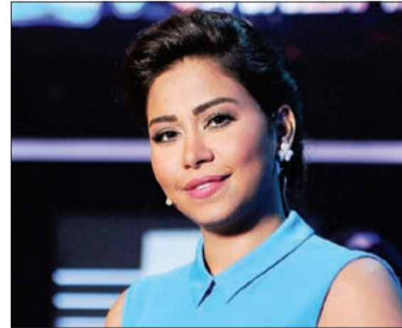
شيرين عبد الوهاب

الوهاب بعد اعتذارها له. يذكر أن شريف منير قد اشترط أن تعتذر رسميا له ولزوجته عما وجهته من إساءة لهما، مقابل وقف المازعات القضائية بينهما، وطلب أيضا ان يكون الاعتذار مكتوبا ومعلنا حتى يقبل التنازل عن القضية بشكل نهائي.