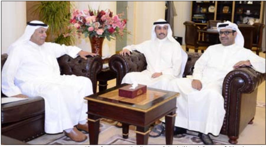
رئيس مجلس الأمة مرزوق الغانم خلال استقباله حسين الخرافي بحضور أحمد القضبي

استقبل رئيس مجلس الأمة مرزوق الغانم في مكتبه امس رئيس مجلس ادارة اتحاد الصناعات الكويتية حسين الخرافي واعضاء مجلس الإدارة. وحضر اللقاء العضو احمد القضبي. كما بعث الرئيس الغانم ببرقية تهنئة الى رئيس المجلس التشريعي في مملكة تونفا «لورد فاكافانو»، وذلك بمناسبة العيد الوطني لبلده.