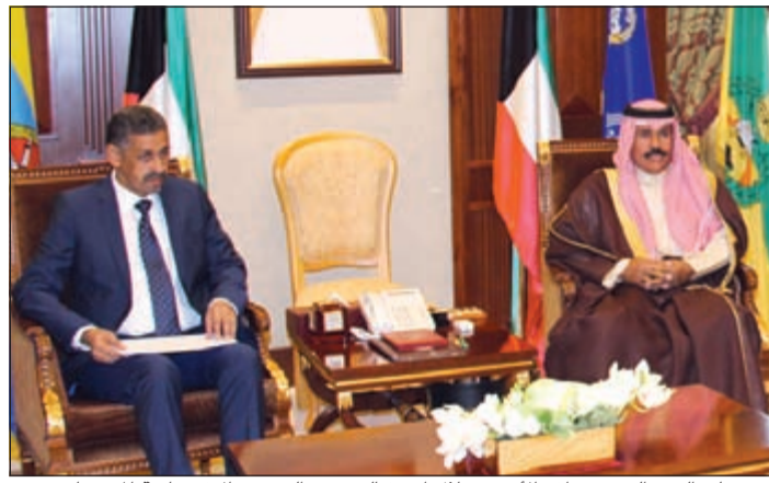
سمو ولي العهد الشيخ نواف الأحمد خلال استقباله وزير الشؤون الاقتصادية الموريتاني

يستقبل سفير دولة قطر الشقيقة السفير حمد بن علي آل حنزاب رواد الديوانية كل يوم أربعاء اعتباراً من اليوم 5 الجاري، وذلك بعد صلاة العشاء.