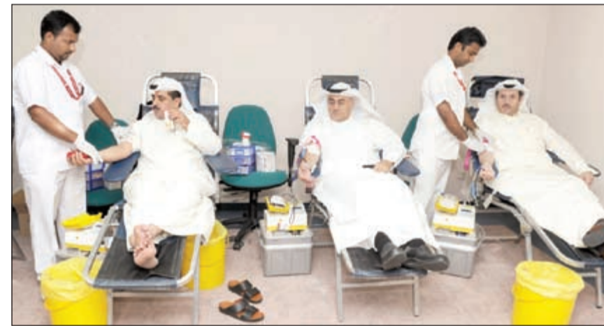
العمالون ب «كونا» اثناء التبرع بالدم