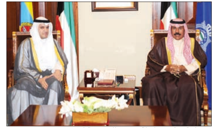
سمو ولي العهد الشيخ نواف الأحمد مستقبلاً د. محمد الهاشل