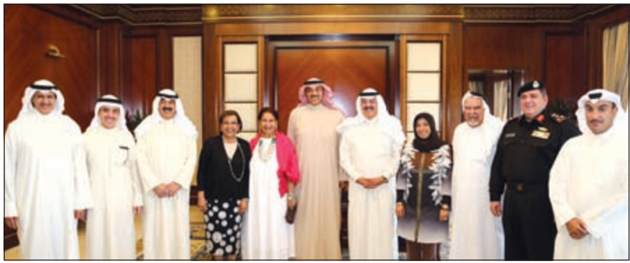
الشيخ صباح الخالد متوسطا أعضاء مجلس أمناء رحلة الأمل