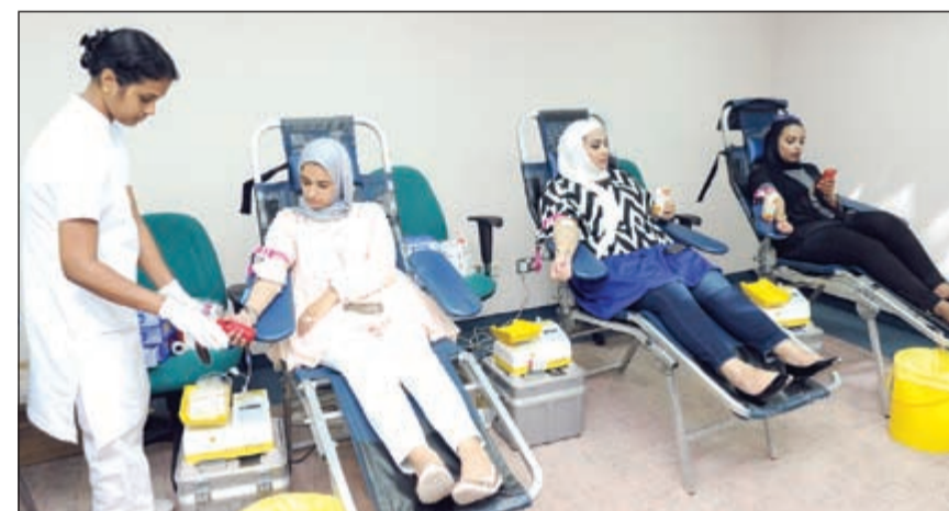
جانب من حملة «كونا» للتبرع بالدم

الفئات العمرية اقبالا على التبرع هم الذين في سن الثلاثينيات لكن مع زيادة الحملات المتنقلة وزيادة الوعي بدأت تزيد نسبة الشباب.