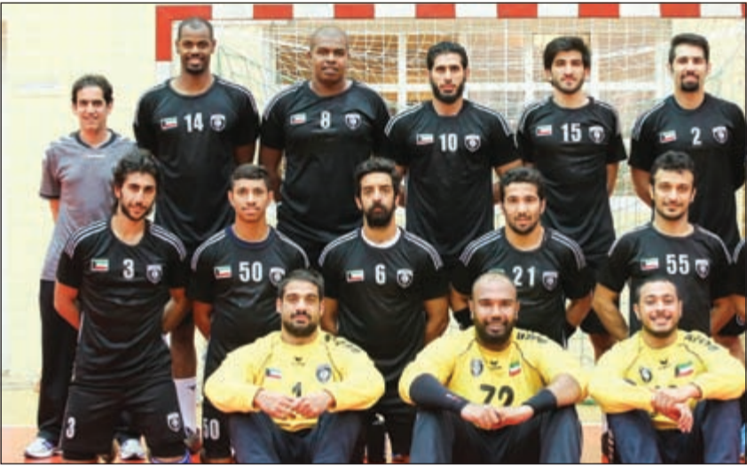
يد القرين يسيء للاستفادة من معسكر السويد بما يخدم طموحه