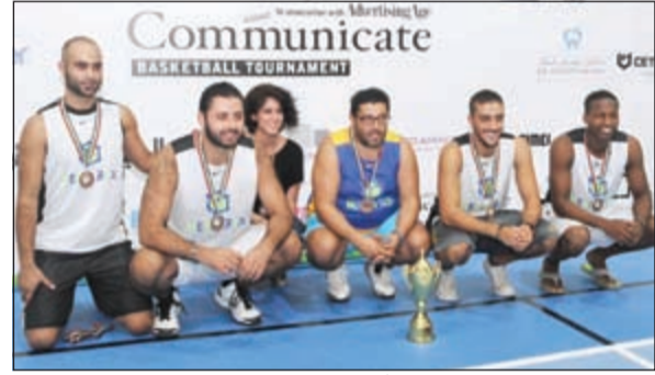
فريق ميديا بوكس حصل على كأس المركز الثالث